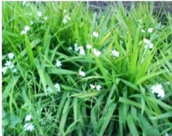
Gambar 1. Bawang Dayak (Puspadewi, et.al, 2013)

berbentuk pita dengan ujung yang runcing. Bawang dayak mempunyai bunga berwarna putih, tumbuh pada ketiak daun atas dan berbentuk silindris. Umbi bawang dayak berbentuk bulat telur, dan berwarna merah. Akar tanaman berupa akar serabut berwarna coklat muda (Naspiah, Iskandar and Moelyono, 2014; Hidayat and Napitupulu, 2015).