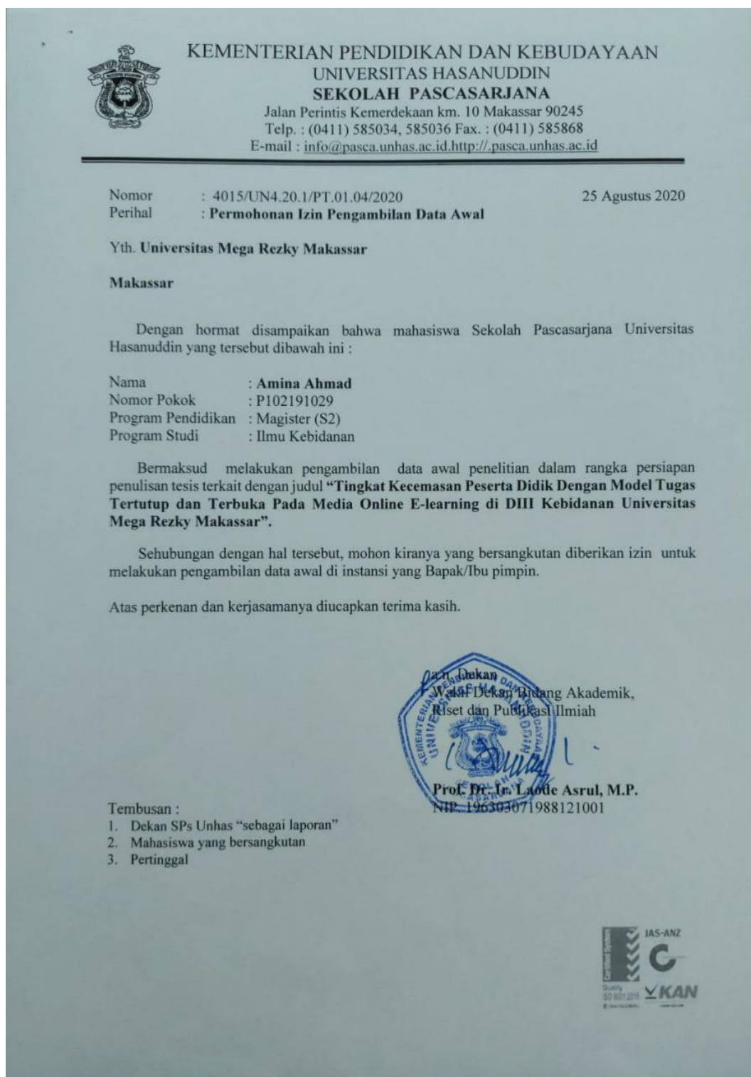
Lampiran 3 Surat Pengantar Pengambilan Data Awal