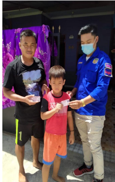
Pelayanan di Dinas Kependudukan dan Pencatatan Sipil Kabupaten Mimika