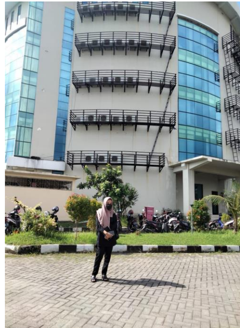
Wawancara dan pengambilan data penelitian