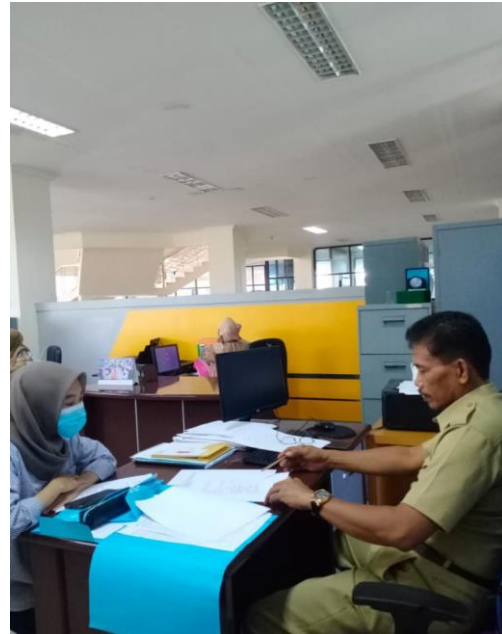
Pengambilan data penelitian dan Pengisian Kuisisioner