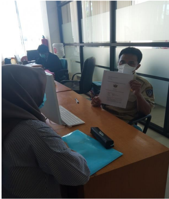
Pengisian kuisisioner dengan responden penelitian