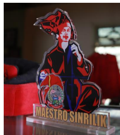
Penghargaan Bapak Tutu selaku Maestro Sinrili '