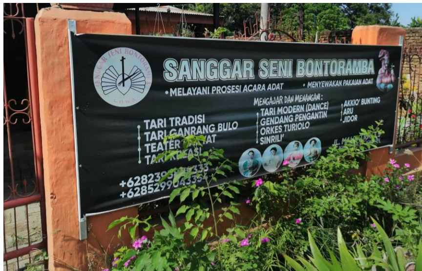
Kediaman Bapak Tutu yang juga merupakan Sanggarnya 21 November 2020