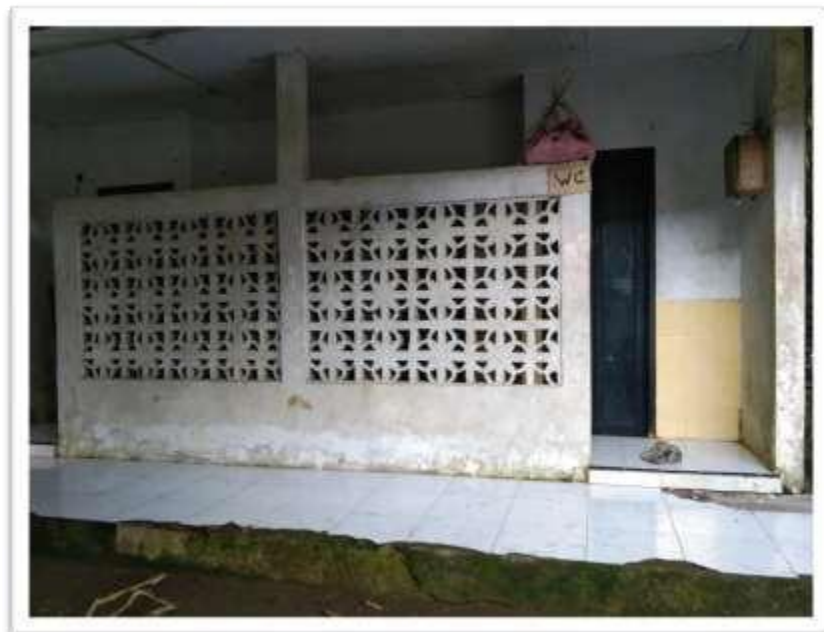
Kondisi WC umum