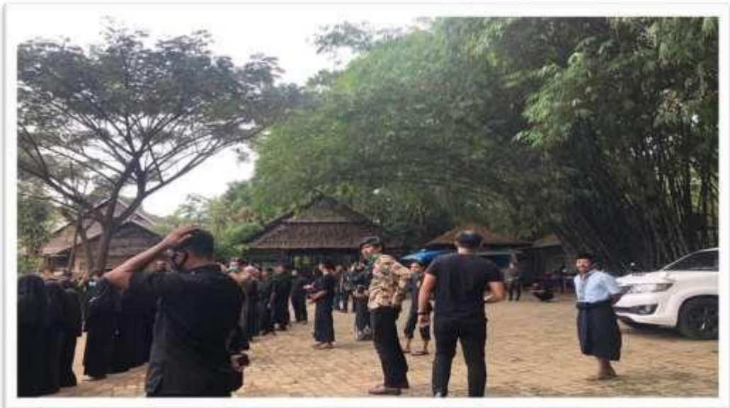
Kondisi Kawasan Adat Ammatoa