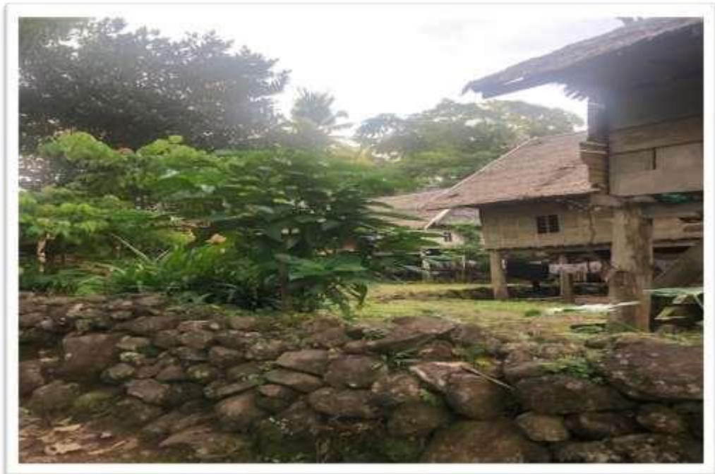
Kondisi Pagar Bola Pabbo"rongan