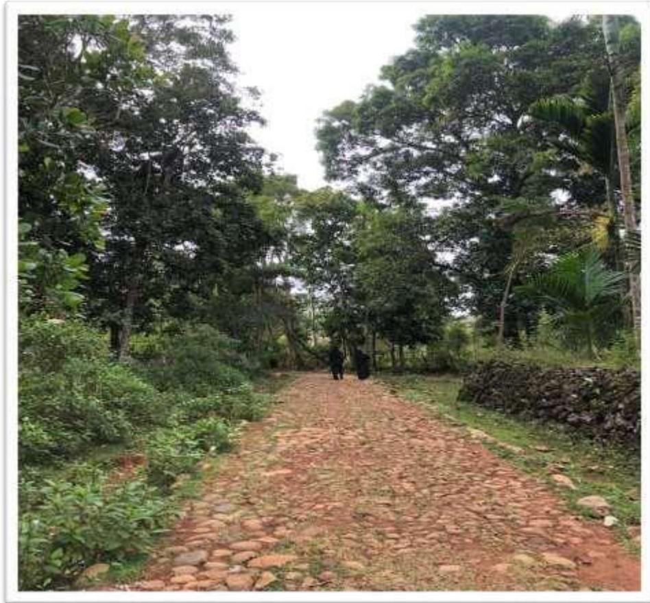
Kondisi Jalanan Plaston