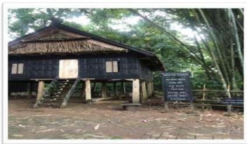
Kondisi Miniatur Rumah Adat