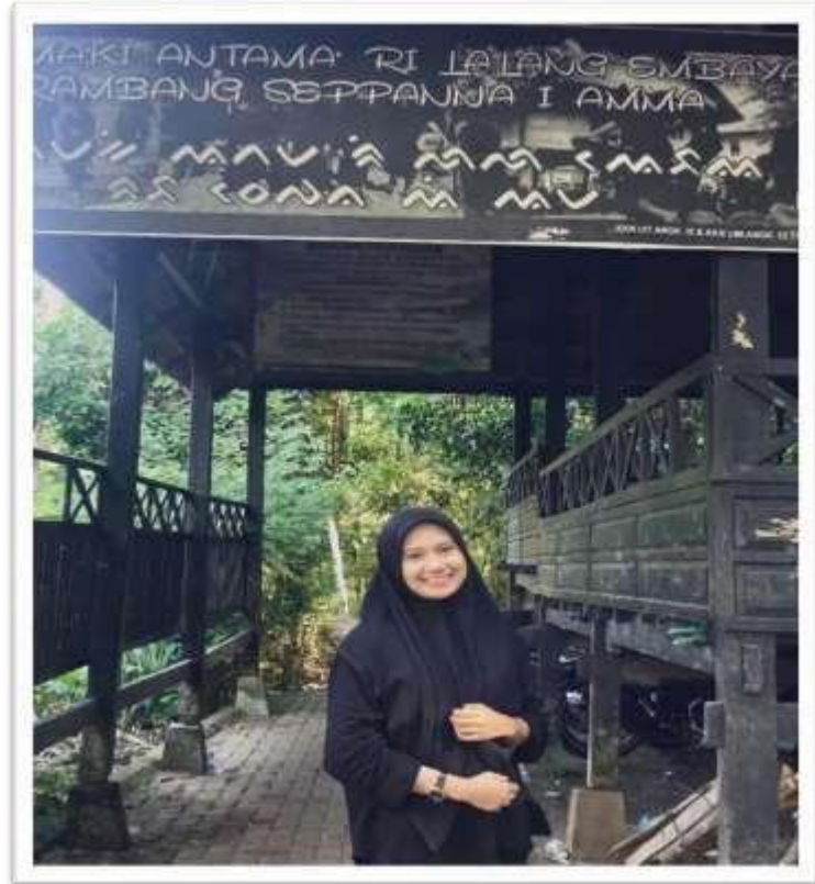
Kondisi Tambalayya (Tapal Batas)