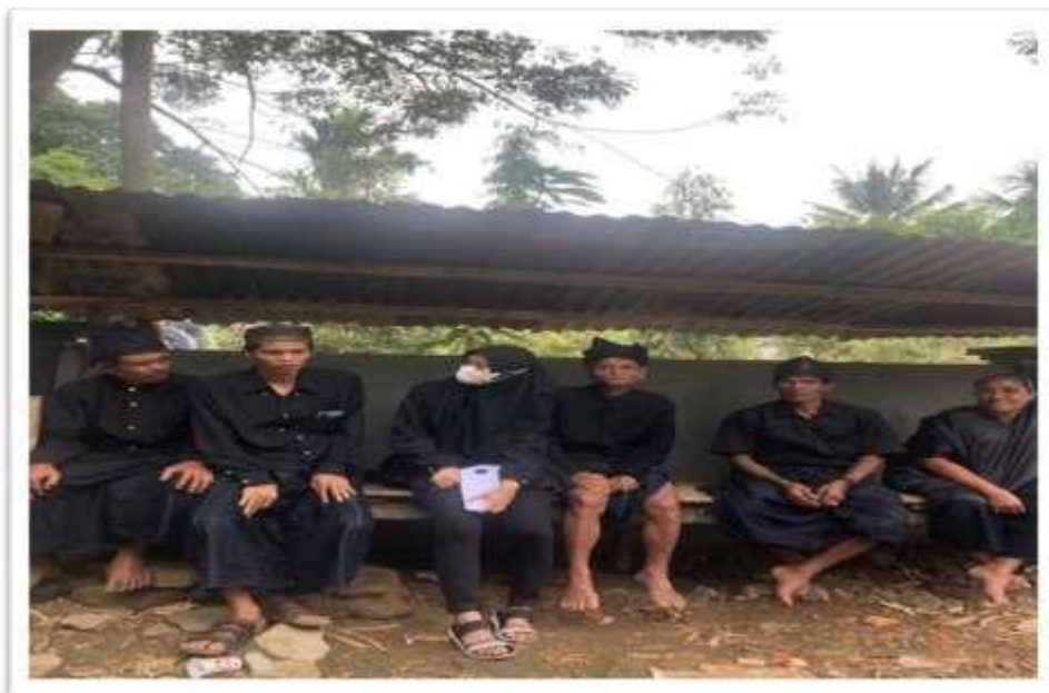
Wawancara bersama Masyarakat yang tinggal di luar kawasan Adat Ammatoa.