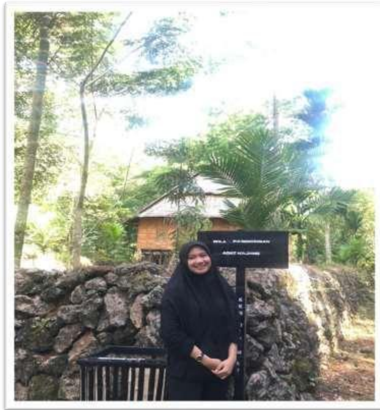
Kondisi Bola Pabbo"rongan (Rumah Musyawarah)