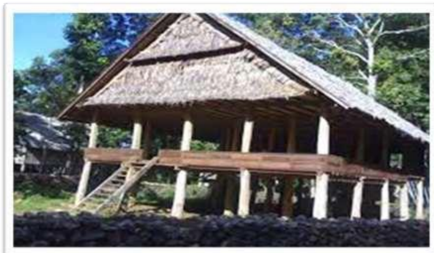
Kondisi Bola Parondaan (Rumah Ronda)