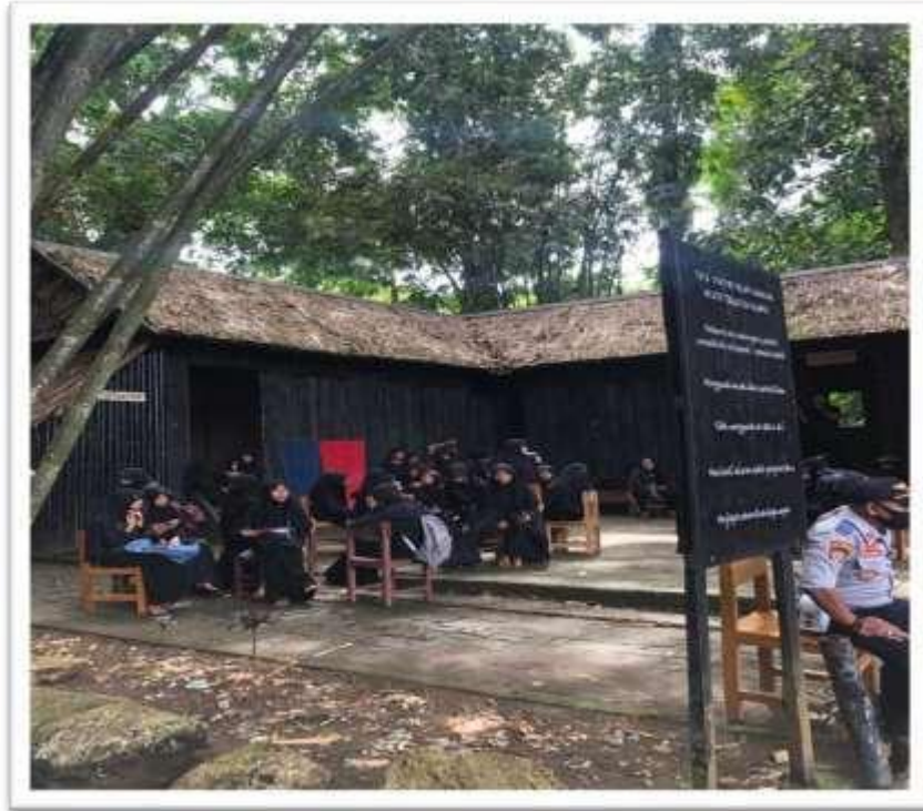
Kondisi Kios Souvenir (Rumah UMKM)