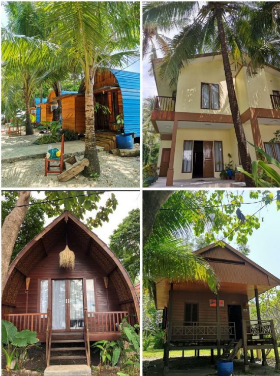
Lampiran 3. Bentuk Promosi Pulau Dutungan