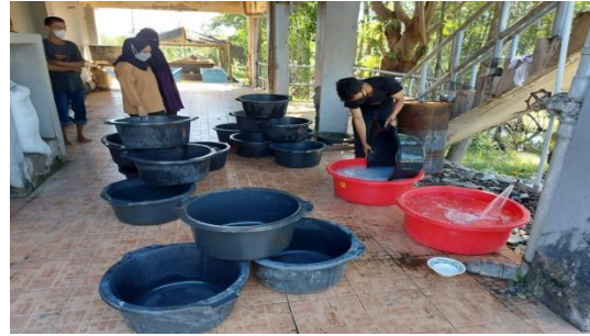
Gambar 2. Perendaman wadah penelitian kedalam larutan kaporit dan natrium tiosulfat