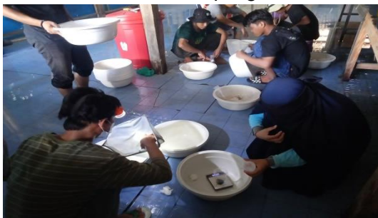
Gambar 21. Proses penimbangan bobot akhir hewan uji