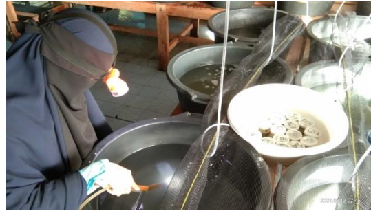
Gambar 12. Proses pengambilan atau penyiponan feces dan sisa pakan