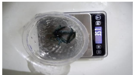
Gambar 22. Bobot hewan uji salah satu perlakuan