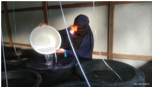
Gambar 13. Penambahan air pada wadah penelitian