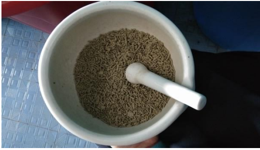
Gambar 9. Penghalusan pakan sampai bebrbentuk crumble