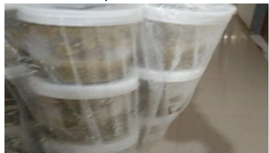
Gambar 24. Feses hewan uji