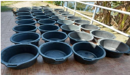
Gambar 3. Pengeringan wadah penelitian