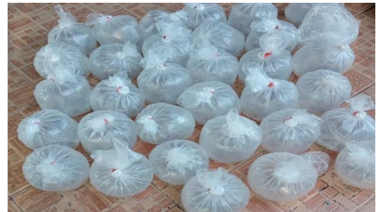
Gambar 4. Pengadaan benur