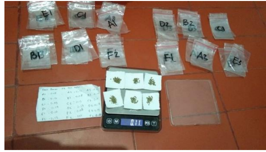
Gambar 10. Penimbangan pakan