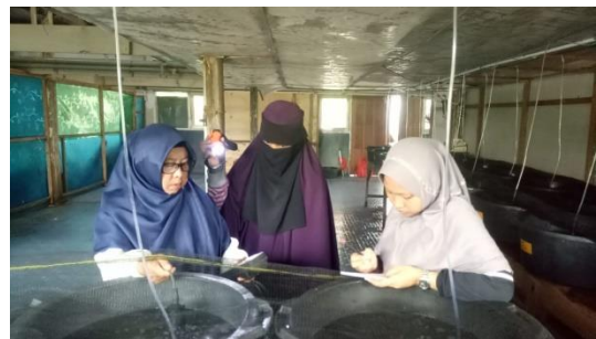
Gambar 16. Pengukuran oksigen terlarut dan pH