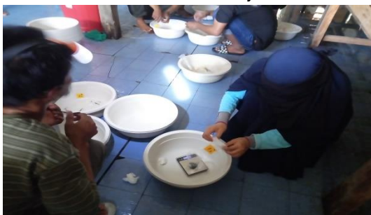
Gambar 23. Proses pemasukan hewan uji ke plastik sampel