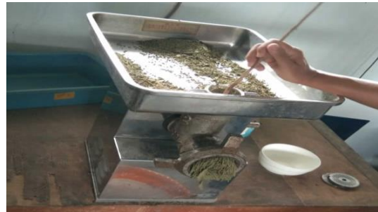
Gambar 6. Pencetakan adonan pakan dengan mesin pencetak pellet