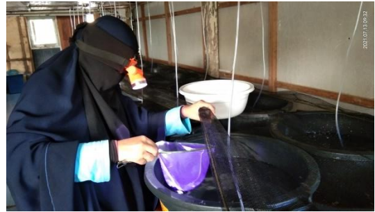
Gambar 18. Proses sampling