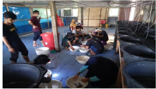
Gambar 20. Panen total hewan uji