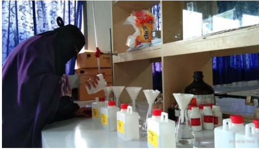
Gambar 17. Penyaringan air/media pemeliharaan untuk pengukuran amonia