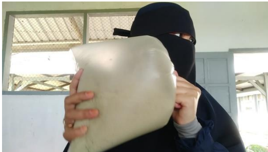
Gambar 5. Pencampuran bahan baku