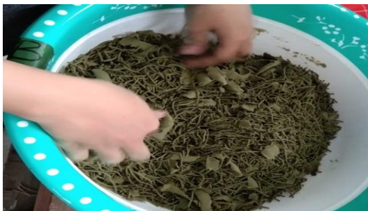
Gambar 7. Pakan berbentuk pellet