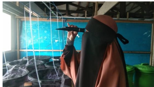
Gambar 14. Pengukuran salinitas