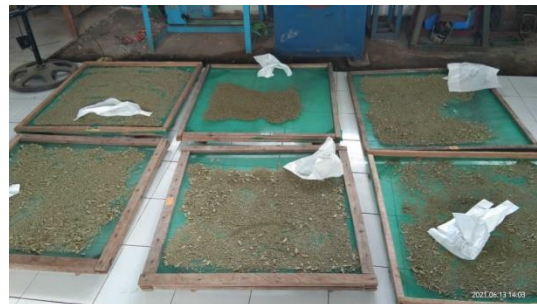
Gambar 8. Pengeringan pakan