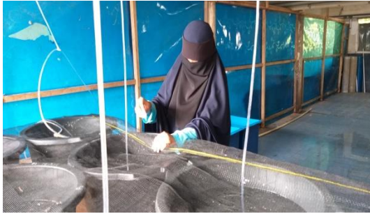
Gambar 11. Pemberian pakan