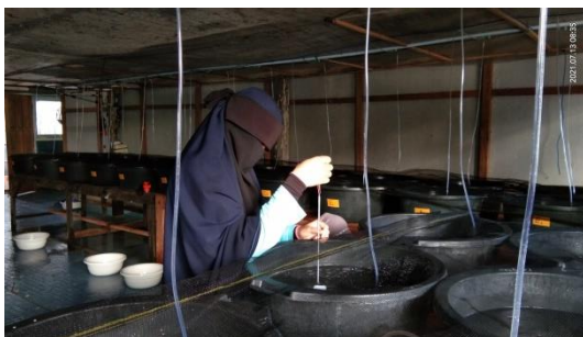
Gambar 15. Pengukuran suhu