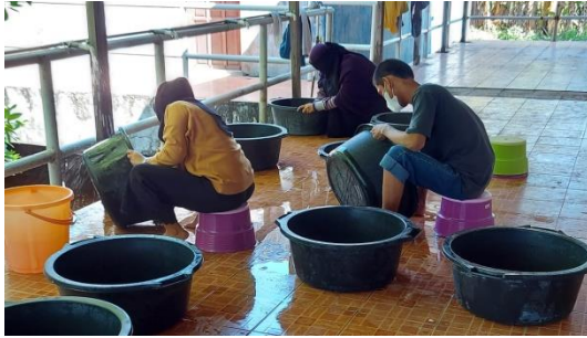
Gambar 1. Pencucian wadah penelitian