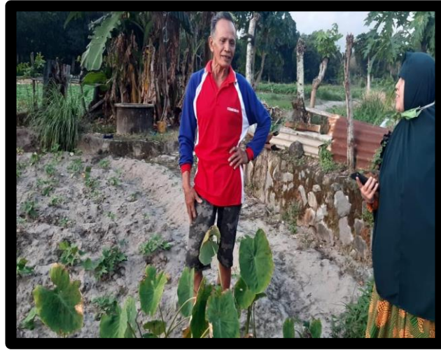
Desa Lappa Lappae Kecamatan Suppa Kabupaten Pinrang