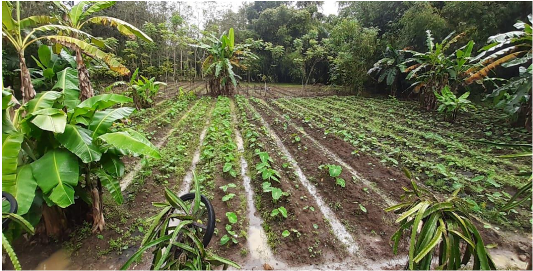
Desa Congko Kecamatan Marioriwawo Kabupaten Soppeng