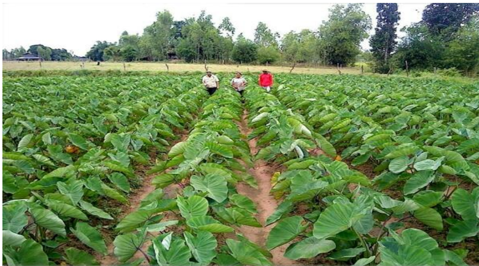
Desa Congko Kecamatan Marioriwawo Kabupaten Soppeng