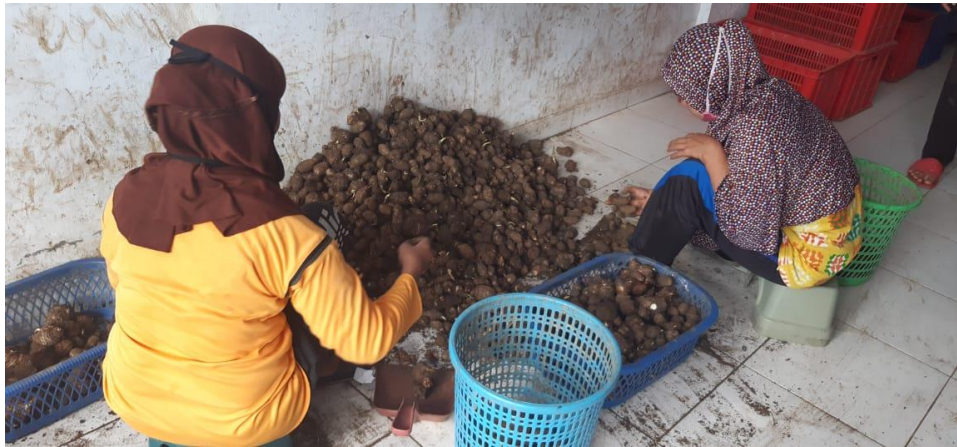
Pabrik Tepung Talas Kota Makassar