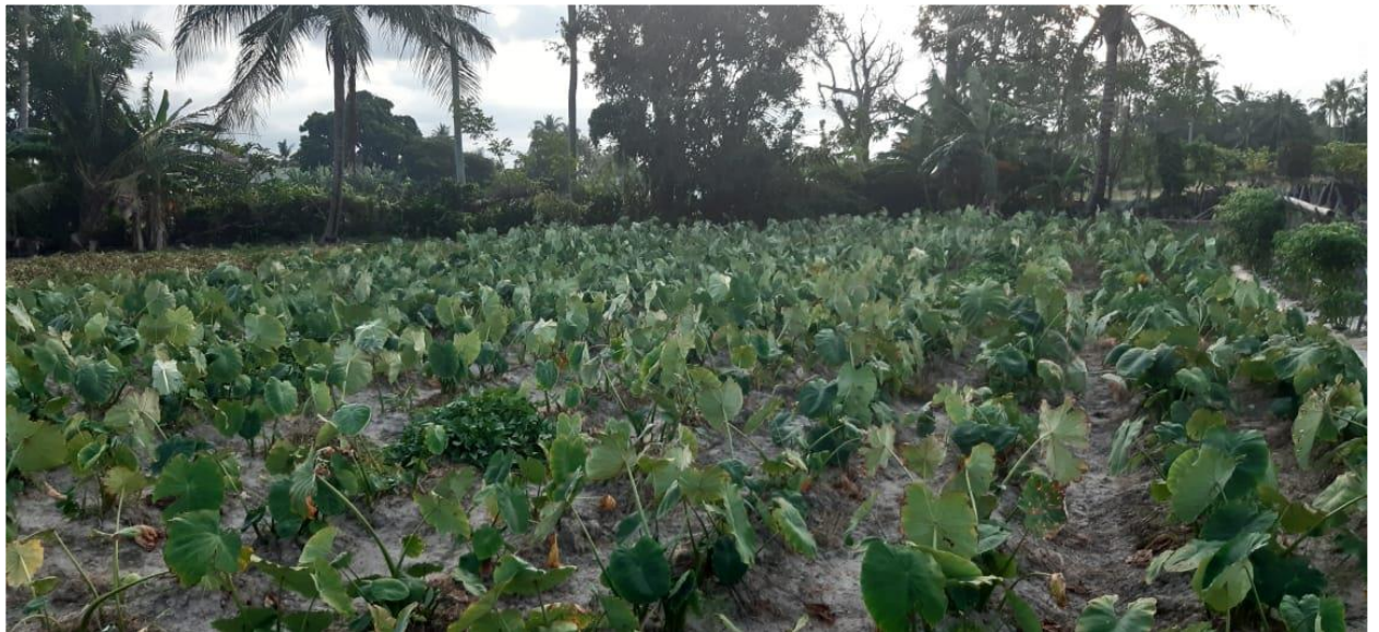
Desa Lappa Lappae Kecamatan Suppa Kabupaten Pinrang