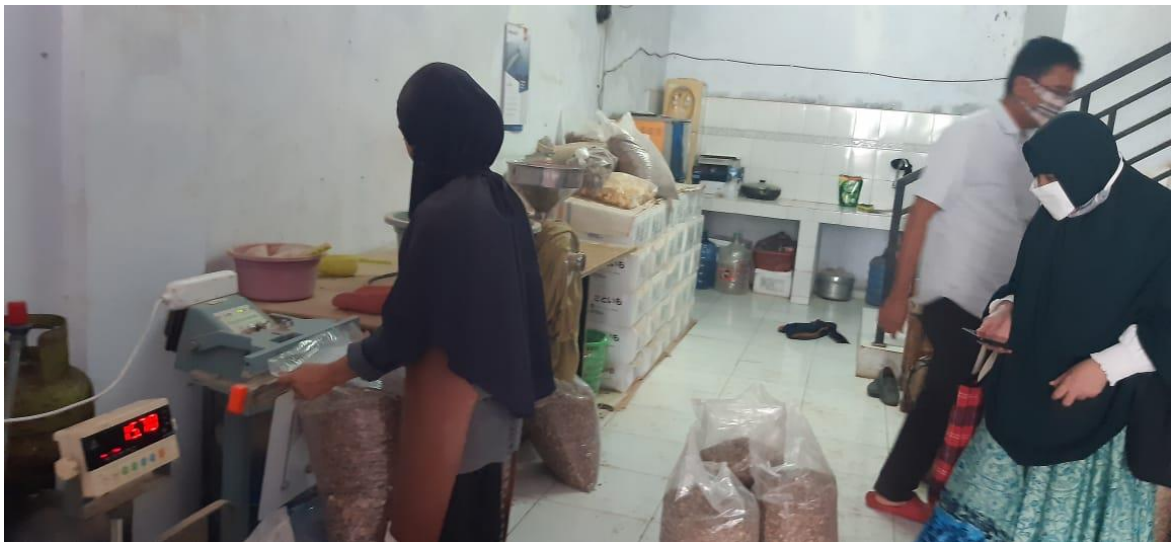
Pabrik Tepung Talas Kota Makassar