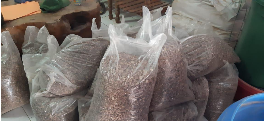
Pabrik Tepung Talas Kota Makassar