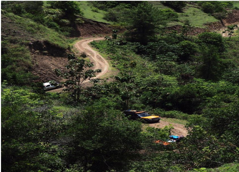
Gambar menuju lokasi wisata alam yang belum dikelola