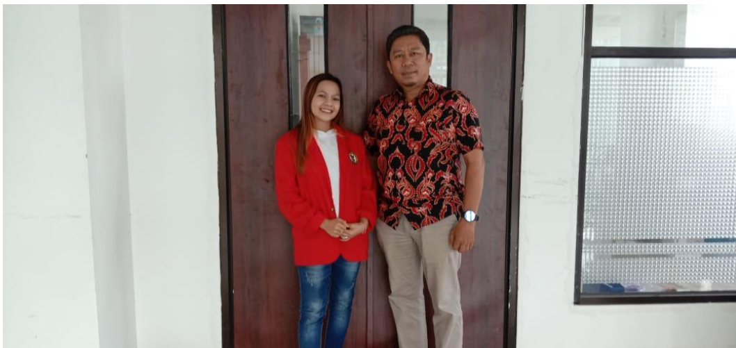
Dokumentasi hasil wawancara bersama seksi kepala bidang pengembangan destinasi