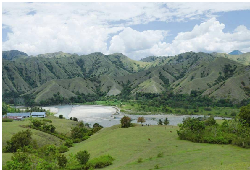
Gambar objek wisata alam ollon