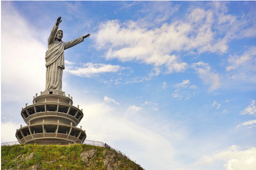
Gambar objek wisata patung religi burake