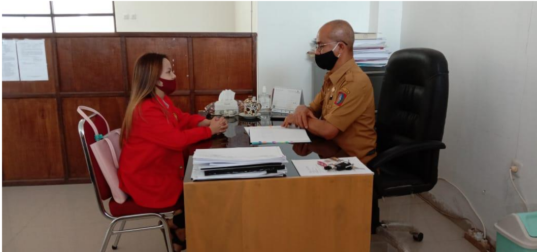
Gambar wawancara bersama pelaksana tugas Kepala Dinas Kebudayaan Kabupaten Tana Toraja