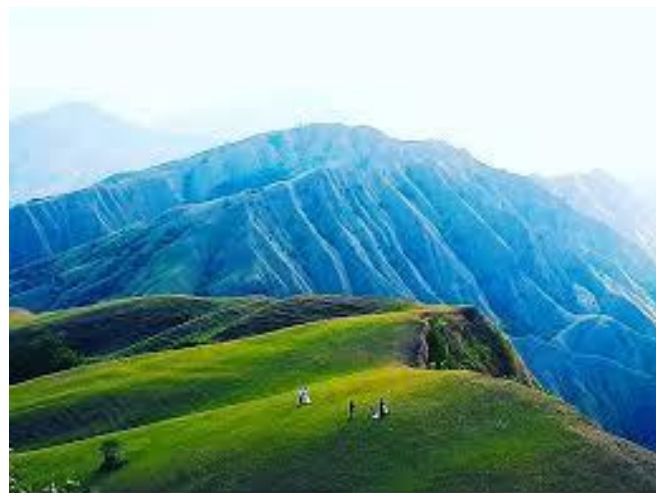
Objek Wisata Alam Tebing Romantis