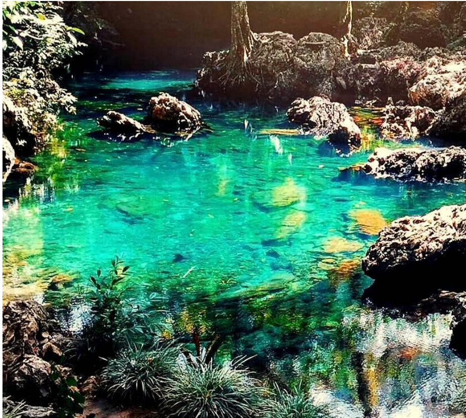
Kolam Air Tilanga