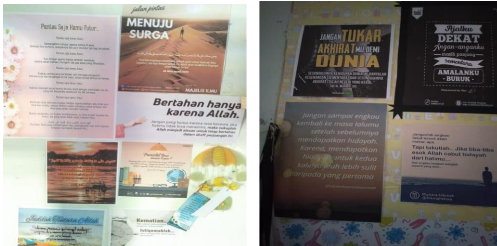
Gambar 2 Kata-Kata Motivasi Akhwat Wahdah Islamiyah yang ditempel di Kamarnya