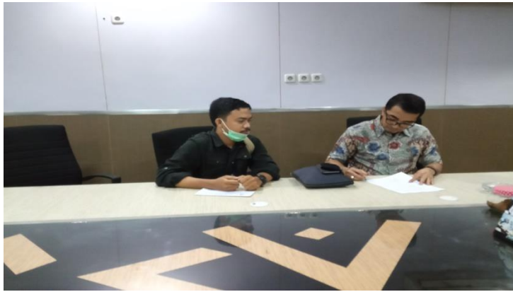
Gambar : Wawancara narasumber anggota Komisi C DPRD Kota Makassar