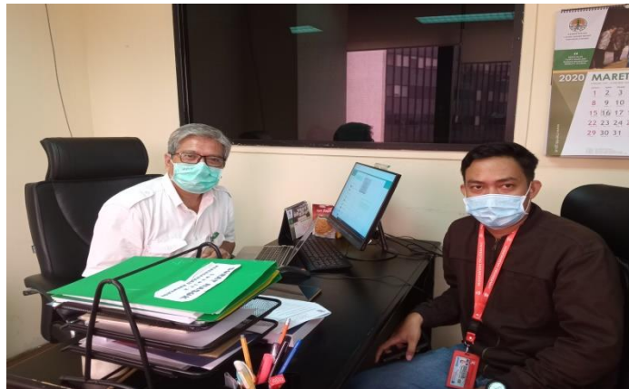
Wawancara narasumber Bidang Adaptasi Perubahan Iklim di Kementerian Lingkungan Hidup dan Kehutanan