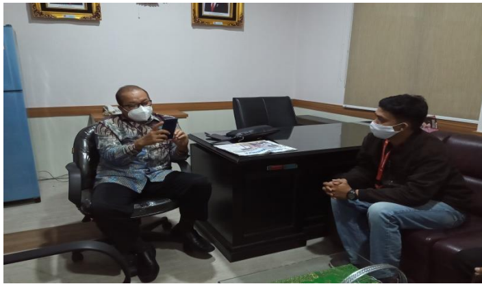
Gambar : Wawancara narasumber anggota Komisi B DPRD Kota Semarang