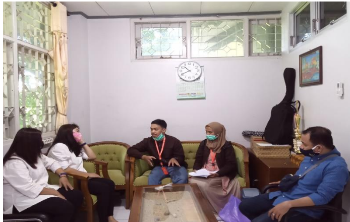
Gambar : Wawancara Narasumber Dinas Lingkungan Hidup Kota Semarang