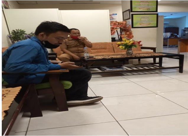
Gambar : Pengambilan data pada Dinas Ketahanan Pangan Kota Makassar