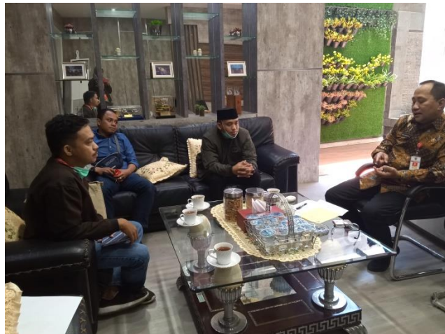
Gambar : Wawancara Narasumber Sekda Kota Semarang