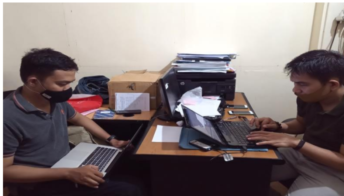
Gambar : Pengambilan data pada Dinas Kelautan dan Perikanan Kota Makassar