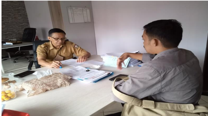
Gambar : Wawancara Narasumber Kepala Dinas Pu Kota Makassar