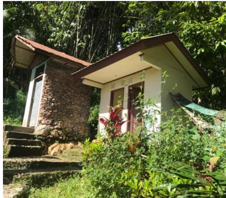
Toilet yang telah dibangun pada kawasan objek wisata Bori' Kalimbuang