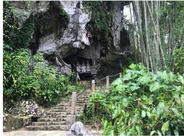
Railing tangga yang telah dibangun pada kawasan objek wisata Ke'te Kesu