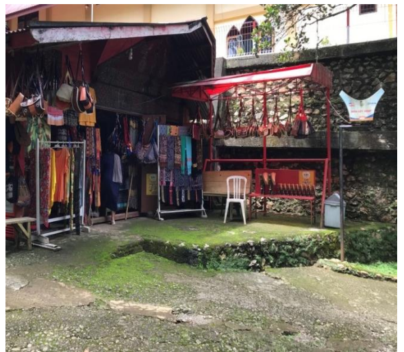
Penjualan souvenir dari Kawasan Objek wisata Londa