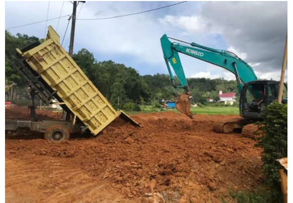
Pembangunan infrastruktur yang sedang berlangsung di kawasan objek wisata Bori' Kalimbuang