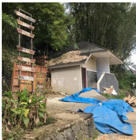
Toilet yang telah dibangun pada kawasan objek wisata Bori' Kalimbuang