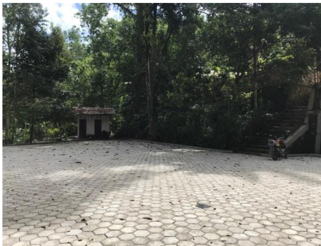
Tempat parkir yang telah dibangun di Kawasan Objek wisata Buntu Pune'