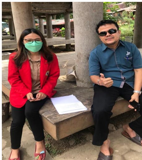
Wawancara bersama wisatawan di kawasan objek wisata Ke'te Kesu