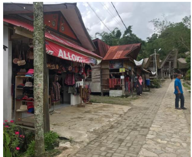
Jalan setapak dan kios souvenir yang telah dibangun oleh dinas kebudayaan dan pariwisata Kabupaten Toraja Utara