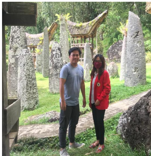
Wawancara bersama wisatawan yang berada di kawasan objek wisata Bori' Kalimbuang