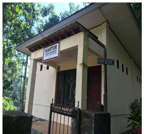
Kantor Yayasan objek wisata Bori' Kalimbuang