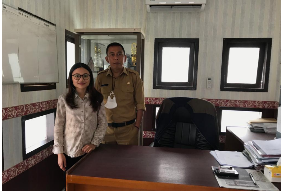
Wawancara dengan Bapak Kepala Dinas Kebudayaan dan Pariwisata Kabupaten Toraja Utara