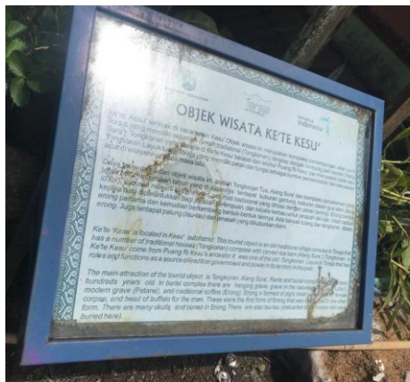
Informasi mengenai Objek wisata Ke'te Kesu