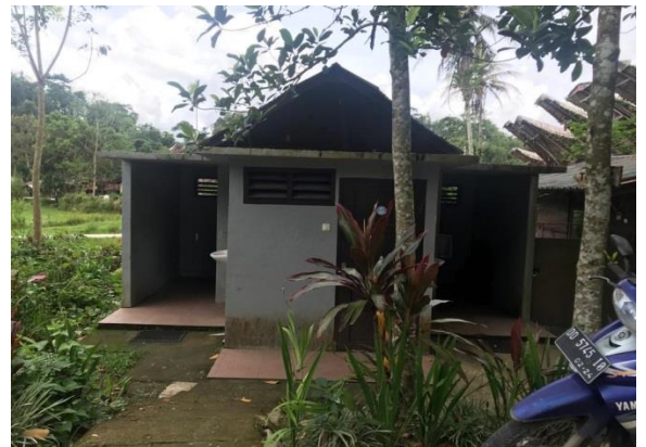
Toilet yang telah dibangun di kawasan objek wisata Ke'te Kesu