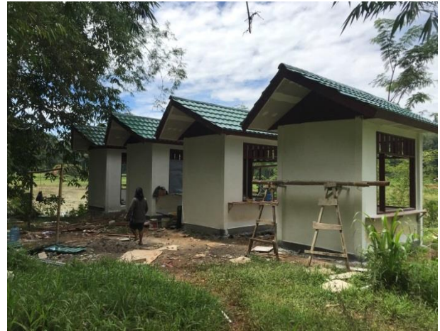
Plaza Kuliner yang sedang dibangun pada kawasan objek wisata Londa