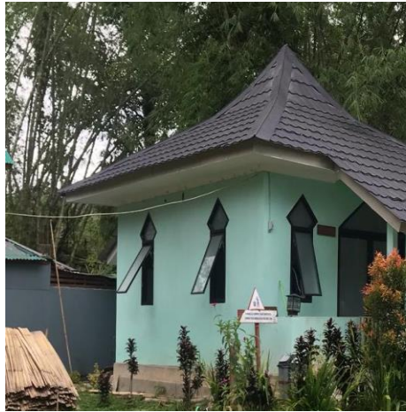
Mushola yang telah dibangun oleh Dinas Kebudayaan dan Pariwisata Kabupaten Toraja Utara