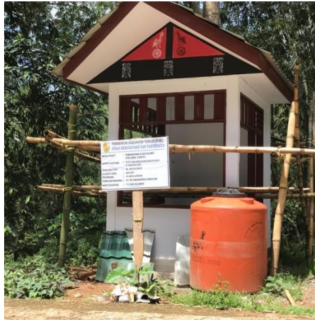
Papan Informasi mengenai pembangunan Plaza Kuliner