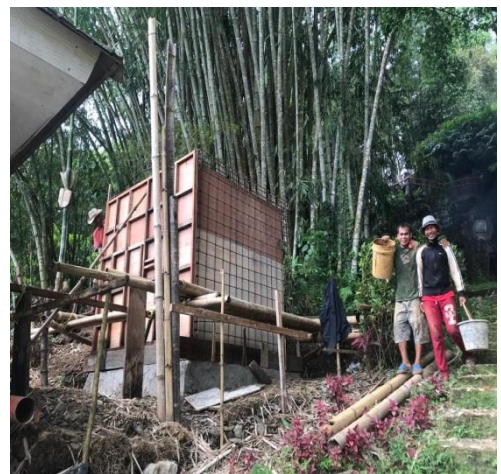
Bak penampungan air yang sedang dibangun pada kawasan objek wisata Bori' kalimbuang