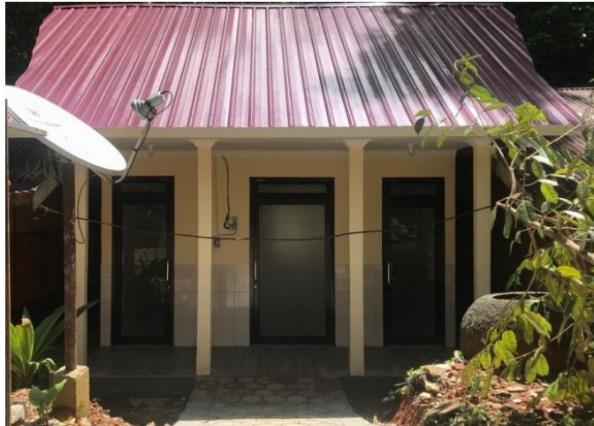
Toilet yang telah dibangun pada kawasan Objek wisata Buntu Pune'