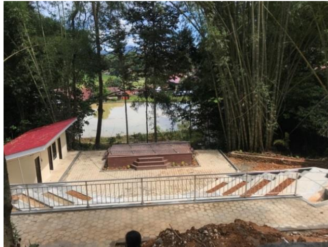
Intiater yang masih sementara dibangun di kawasan Objek Wisata Buntu Pune'