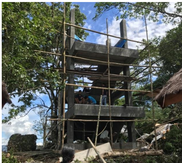
Menara Pandang yang sementara dibangun di Kawasan Objek wisata Buntu Pune'