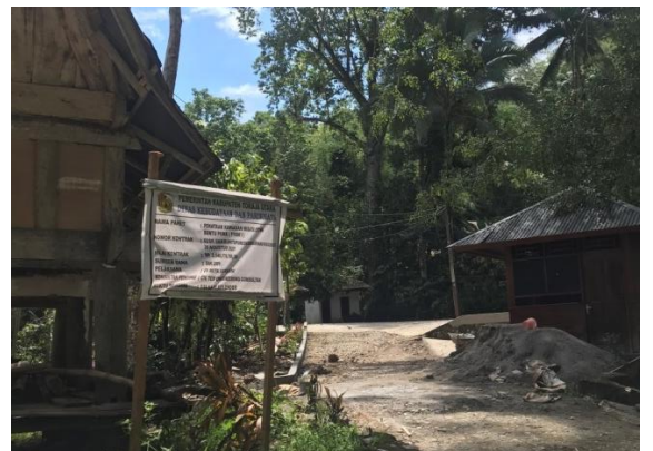
Papan Informasi mengenai pembangunan yang sedang berlangsung di Kawasan Objek Wisata Buntu Pune'