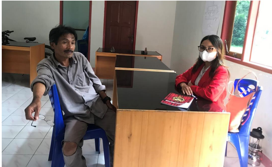
Wawancara bersama pengelola kawasan objek wisata Londa