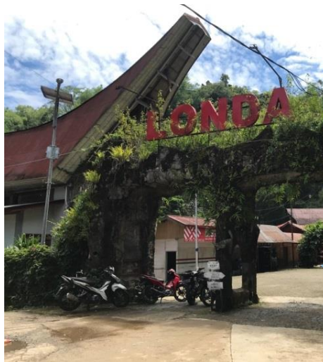
Kawasan objek wisata Londa