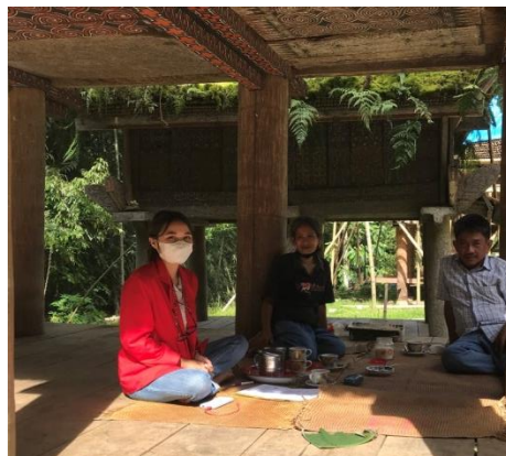
Wawancara bersama Pengelola objek wisata Buntu Pune' Kabupaten Toraja Utara