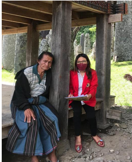
Wawancara bersama Bapak Pengelola Objek wisata Bori' Kalimbuang