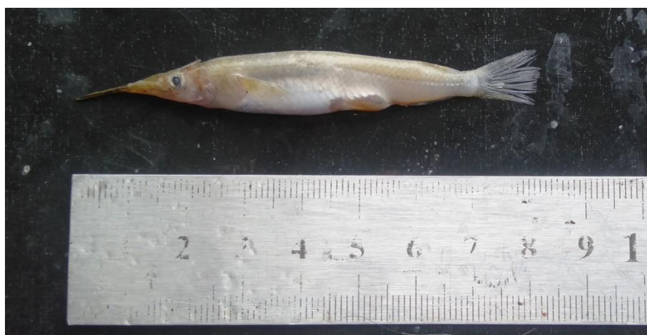
Gambar 1. Ikan ancung, Dermogenys orientalis (Weber, 1894) yang tertangkap di perairan S. Batubassi

Klasifikasi ikan ancung berdasarkan Nelson et al. (2016), Fricke et al. (2021), serta Froese dan Pauly (2021), yaitu: Filum Chordata, Subfilum Craniata, Infracelas Vertebrata, Superkelas Gnathostomata, Grade Teleostomi, Kelas Osteichthyes, Subkelas Actinopterygii, Infracelas Holostei, Divisi Teleostomorpha, Subdivisi Teleostei, Supercohort Teleocephala, Cohort Euteleostei, Superordo Acanthopterygii, Seri Percomorpha, Subseri Ovalentaria, Ordo Beloniformes, Subordo Exocoeloides (=Belonoides), Famili Zenarchopteridae, Genus Dermogenys , Spesies Dermogenys orientalis (Weber, 1894).