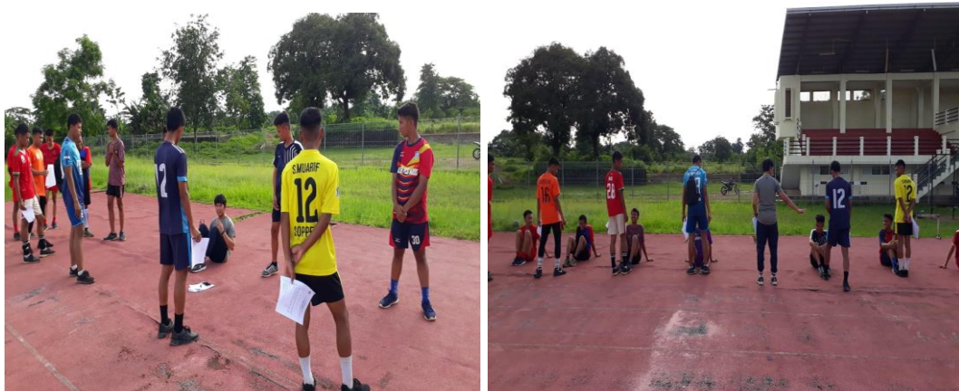
Pemberian penjelasan tes sit up dan pelaksanaannya