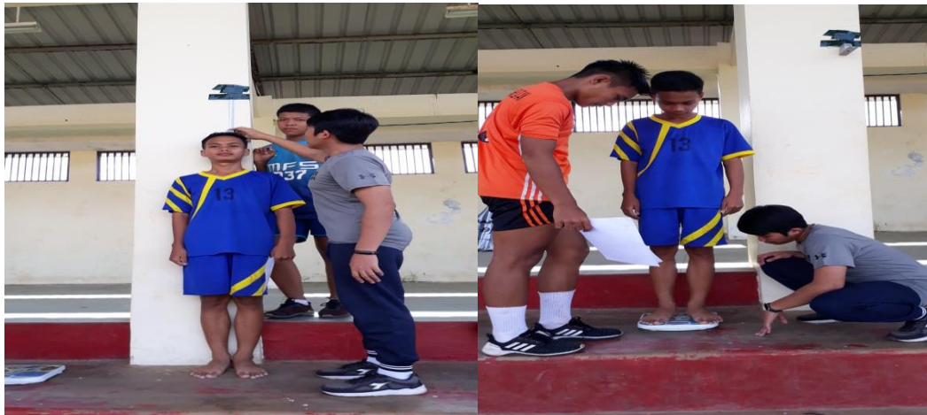
Pengukuran tinggi badan dan berat badan