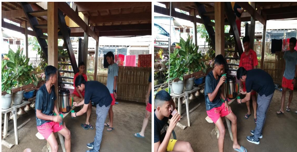
Pemberian intervensi air gula merah aren