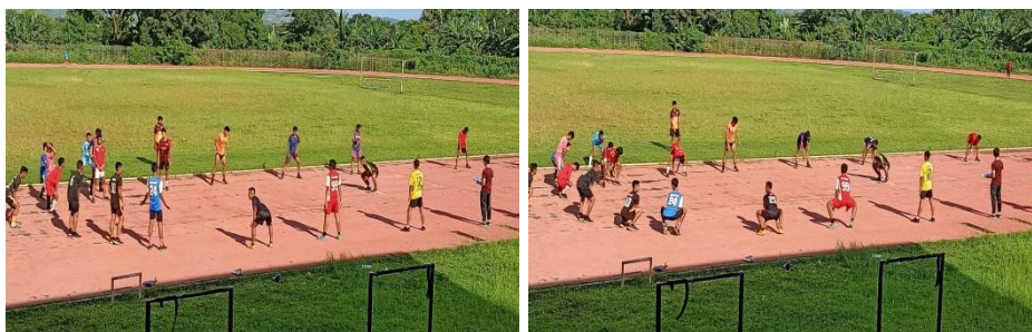
Pemanasan sebelum melaksanakan tes