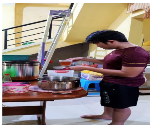
Proses pembuatan air gula merah aren