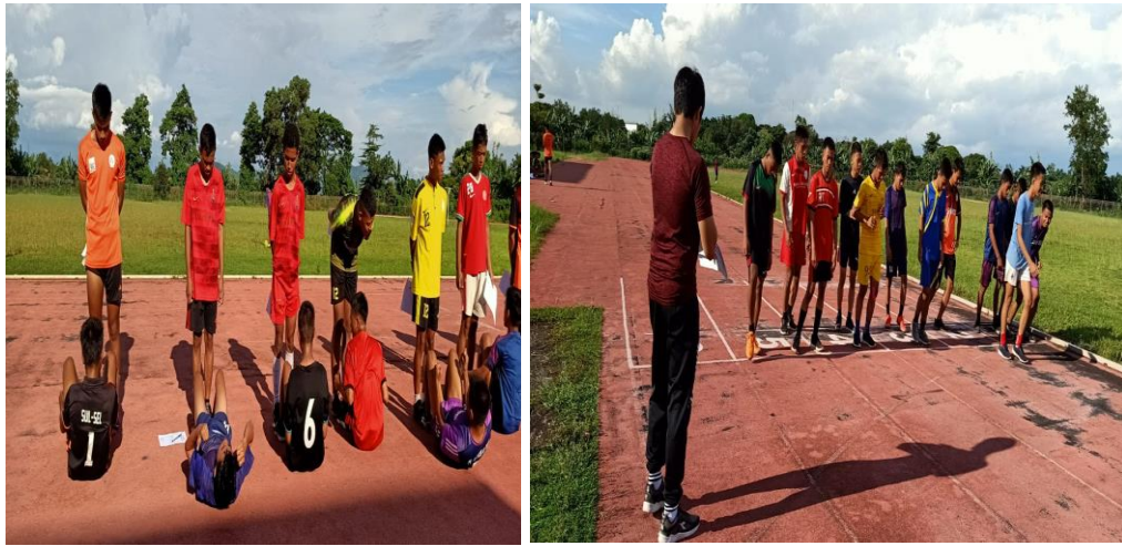
Pelaksanaan tes daya tahan