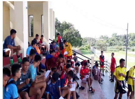
Pemberian lembar penjelasan penelitian kepada responden