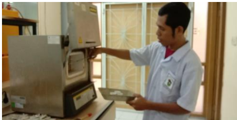
Memasukan bahan ke tanur (BO)