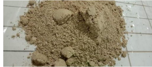
keadaan dibuka setelah 30 hari