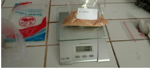
Penimbangan bahan pakan