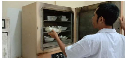
Memasukkan sampel ke oven (BK)