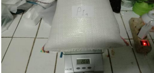
dimasukan dalam karung