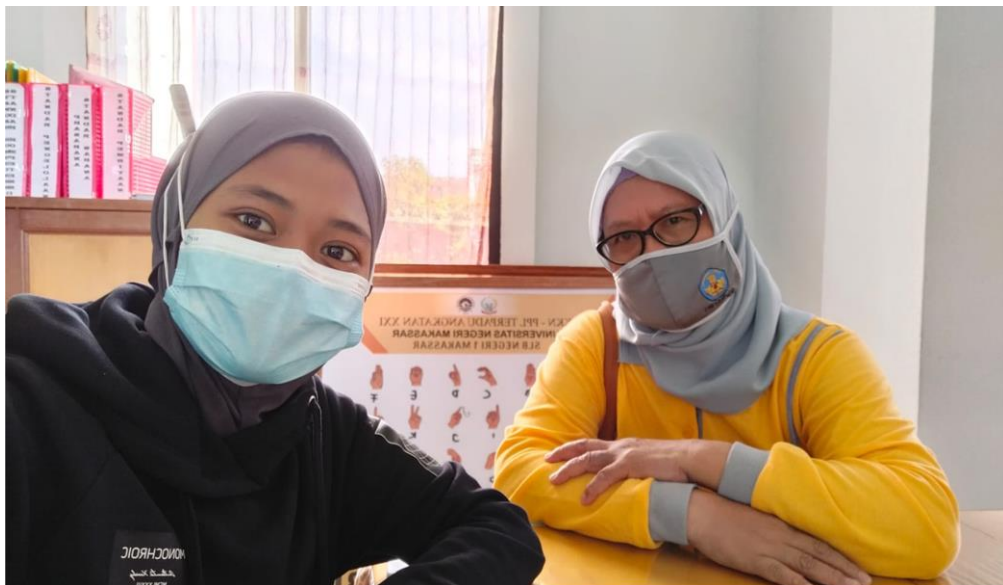
Wawancara Bersama Wakil Kepala Sekolah Bidang Kurikulum UPT SLB Negeri 1 Makassar