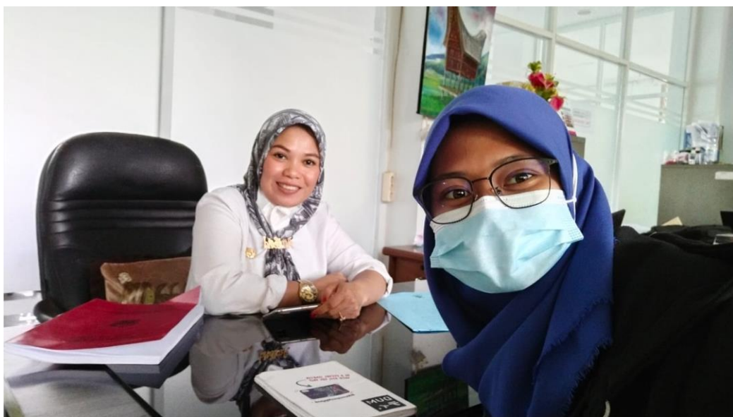
Wawancara Bersama Pegawai Bidang Peserta Didik PK-LK Dinas Pendidikan Provinsi Sulawesi Selatan