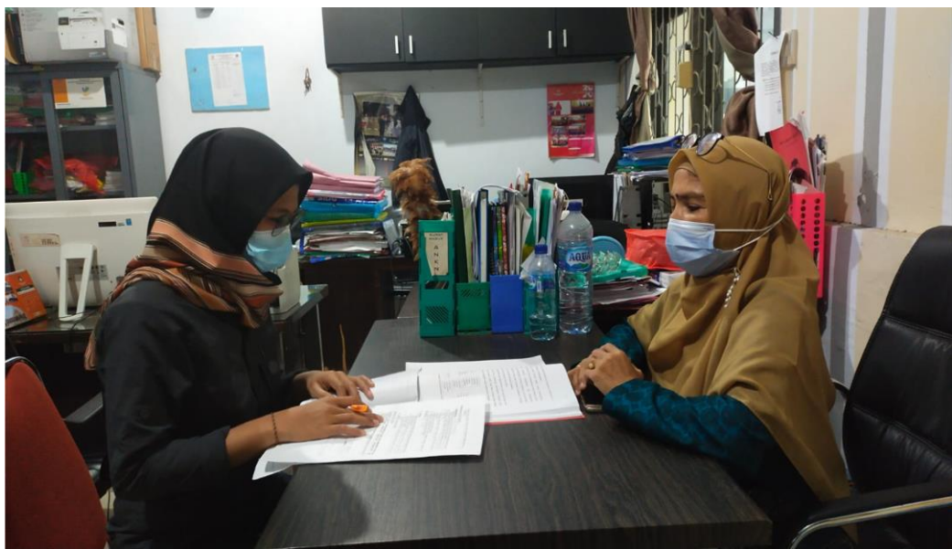
Wawancara Bersama Kepala Bidang Rehabilitasi Penyandang Cacat Dinas Sosial Kota Makassar