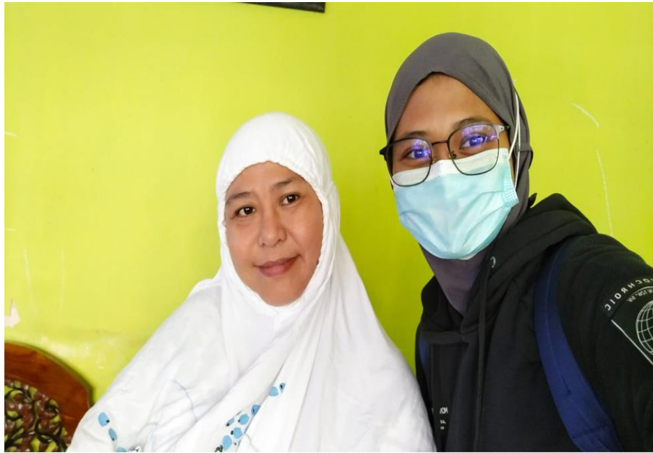
Wawancara Bersama Juru Bayar UPT SLB Negeri 1 Makassar