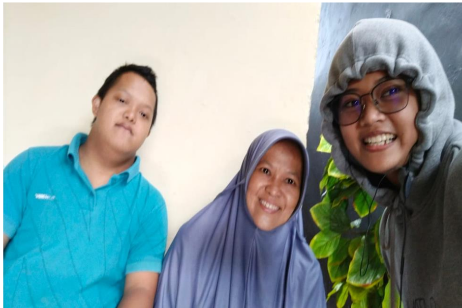
Wawancara Bersama Orang Tua dan Siswa UPT SLB Negeri 1 Makassar