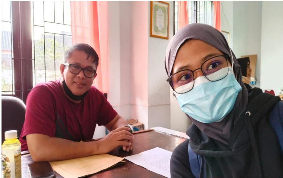
Wawancara Bersama Plt. Kepala Sekolah UPT SLB Negeri 1 Makassar