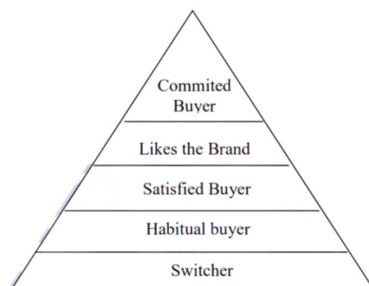
Gambar 2.2. Piramida Loyalitas

Aaker (2013) menerangkan loyalitas pelanggan pada merek mempunyai beberapa tingkatan. Yaitu: