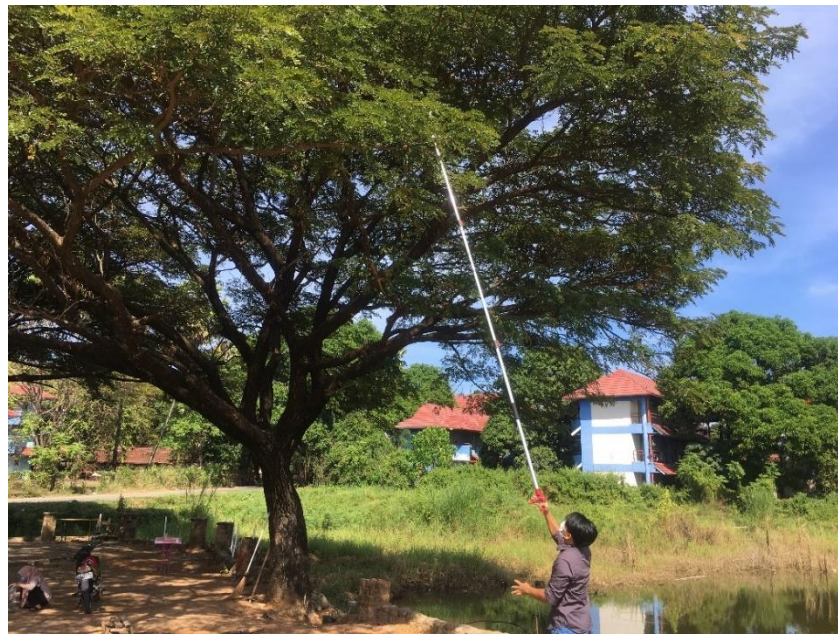
Gambar 1. Tanaman Trembesi ( Samanea saman (Jacq.) Di Kampus Universitas Hasanuddin

penanaman yang luas misalnya hutan kota. Selain itu, ranting pohon trembesi sangat rapuh dan mudah patah. Hal ini terlihat jelas dari banyaknya ranting yang jatuh dan mengenai kabel listrik yang ada di sekitar pohon (Pratiwi et al., 2020). Bentuk batangnya tidak beraturan, dengan daun majemuk yang panjangnya sekitar 7-15 cm, sedangkan pada pohon trembesi yang sudah berwarna kecoklatan, permukaan kulit kasar, dan terkelupas. Bunga tanaman ini berwarna putih dengan bercak merah mudah pada bagian bulu atasnya, Panjang bunga mencapai 10 cm dari pangkal bunga hingga ujung bula bunga. Bunga trembesi menghasilkan nektar untuk menarik serangga guna berlangsungnya proses penyerbukan. Buah trembesi berwarna coklat kehitaman Ketika buah sudah masak, dengan biji tertanam dalam daging buah (Ali et al., 2020). Salah satu tambahan yaitu daun trembesi ini dapat digunakan dalam pengobatan tradisional. Daunnya memiliki kegunaan yaitu bisa dijadikan sebagai bahan obat tradisional seperti diare, demam, sakit perut, dan sakit kepala (Setiawan et al., 2019).