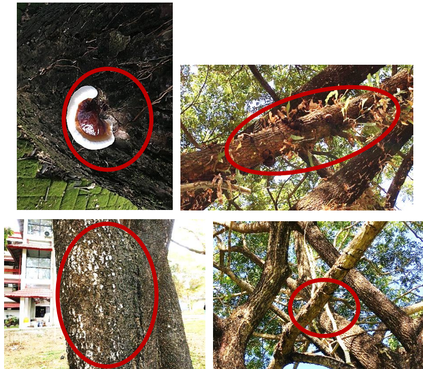
Gambar 3. Jenis Jamur yang Menyerang Pohon Trembesi

perlu mendapatkan perhatian khusus pada bidang kehutanan, karena tegakan atau tanaman sehat tidak akan diperoleh apabila penanganan hama dan penyakit masih diabaikan. Penyebab terjadinya hama dan penyakit pada trembesi karena adanya faktor cuaca seperti suhu dan kelembaban yang menyebabkan adanya patogen dan klorosis yang menyerang pada trembesi serta tempatnya yang terbuka (Hasmiah et al., 2010). Bahwasanya untuk menentukan pohon tersebut terserang penyakit kita bisa melihat apabila pohon tersebut diserang oleh jamur. Salah satu jamur yang menyerang pohon trembesi adalah G. steyaertanum .