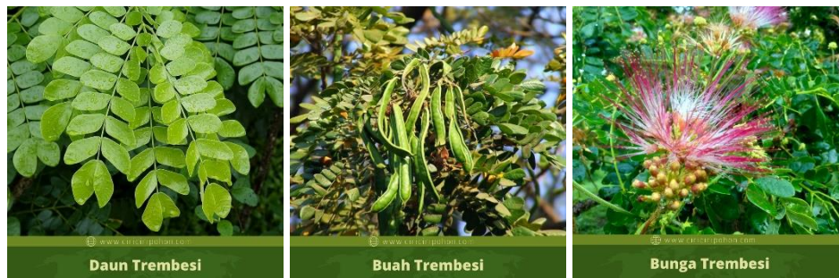
Gambar 2. Daun trembesi (a), buah trembesi (b) dan bunga trembesi (c)

Biji dalam polong terbentuk dalam 6-8 bulan, dan setelah tua akan segera jatuh. Polong berukuran 15-20 cm berisi 5- 20 biji. Biji yang berwarna coklat kemerahan, keluar dari polong saat polong terbuka. Biji memiliki cangkang yang keras, namun dapat segera berkecambah begitu kena di tanah. Biji dapat dikoleksi dengan mudah dengan cara mengumpulkan polong yang jatuh dan mengeringkannya hingga terbuka (Nuroniah & Kosasih, 2010).