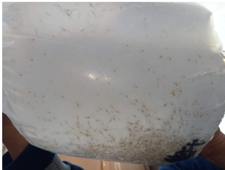
Benih Udang yang Siap Untuk di tebar