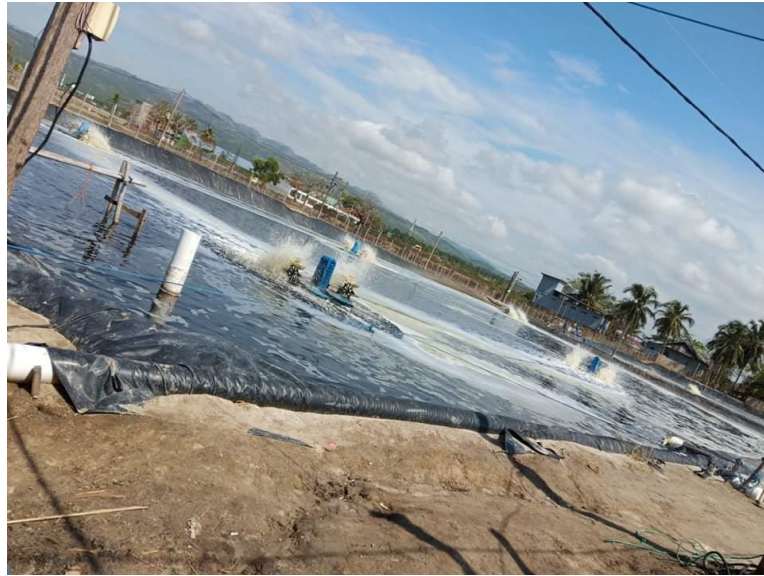
Proses Penetralan Kualitas Air