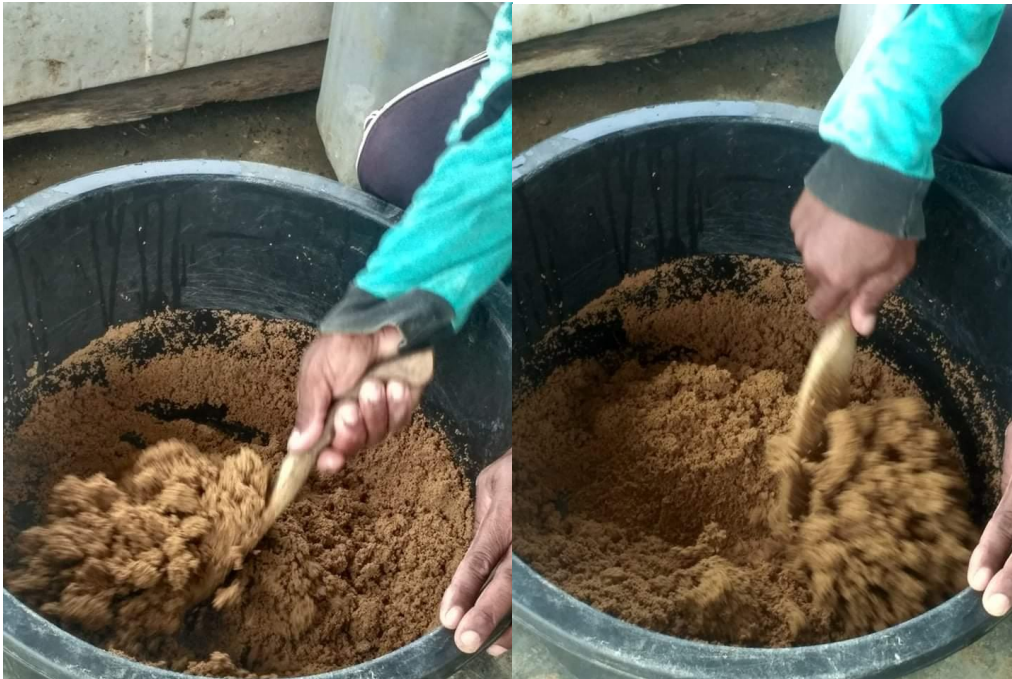
Pemerataan Campuran Pakan Udang