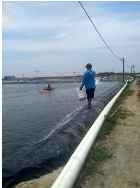
Proses pemberian Pakan