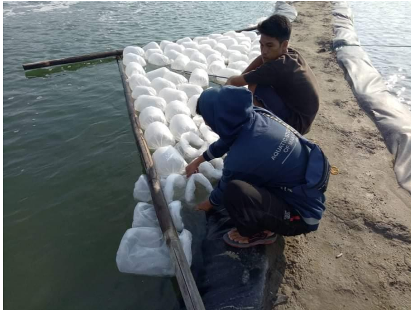
Proses Penebaran Bibit Udang