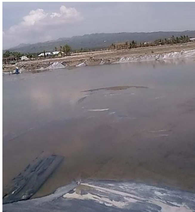
Proses Pengeringan Tambak