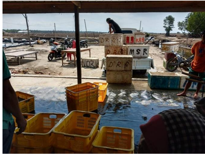
Proses Pengiriman Hasil Panen Udang