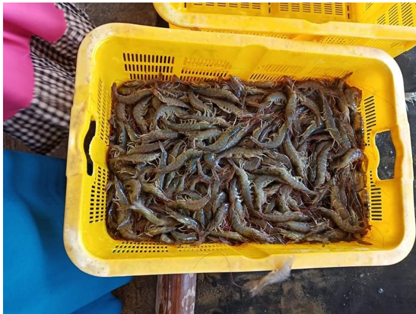
Hasil Panen Udang