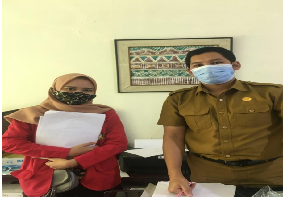
Foto Bersama Pegawai Sekretariat Daerah Kabupaten Toraja Utara