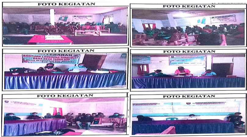
Foto kegiatan sosialisasi yang menghadirkan masyarakat penerima bantuan, aparat desa, tokoh masyarakat dan Tenaga Fasilitator BSPS di Desa Malimbong