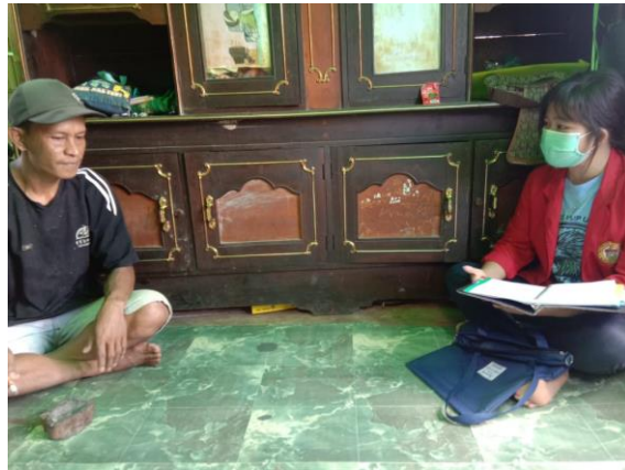
Wawancara dengan Tenaga Fasilitator Lapangan dan juga selaku toko masyarakat