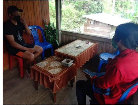
Wawancara dengan Kepala Desa Malimbong