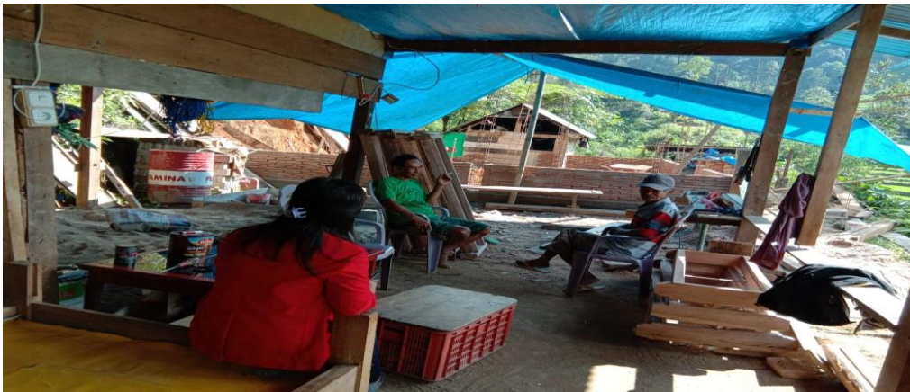
Wawancara dengan penerima bantuan dan masyarakat umum