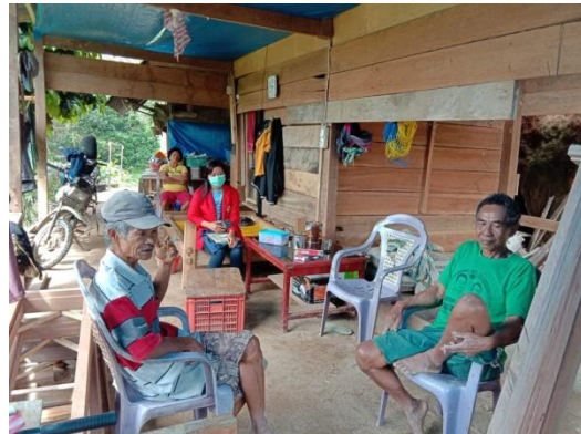
Wawancara dengan penerima bantuan dan masyarakat umum