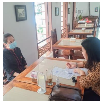
Pengambilan Data Kecamatan Wajo