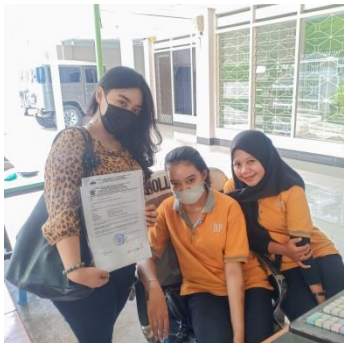
Pengambilan Data Kecamatan Ujung Pandang