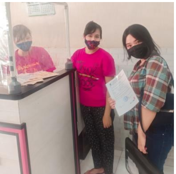
Pengambilan Data Kecamatan Ujung Pandang