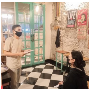
Pengambilan Data Kecamatan Tamalanrea