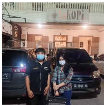
Pengambilan Data Kecamatan Wajo