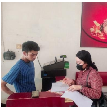
Pengambilan Data Kecamatan Tamalanrea