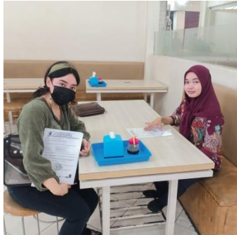
Pengambilan Data Kecamatan Panakkukang