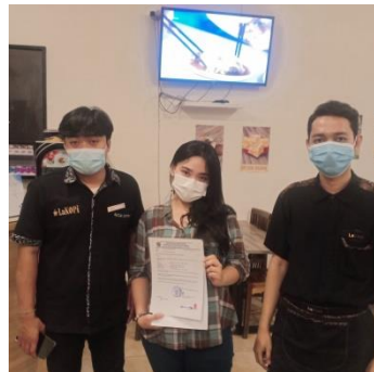
Pengambilan Data Kecamatan Wajo