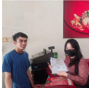
Pengambilan Data Kecamatan Tamalanrea