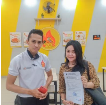
Pengambilan Data Kecamatan Rappocini