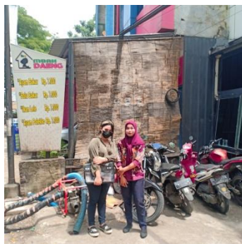
Pengambilan Data Kecamatan Panakkukang