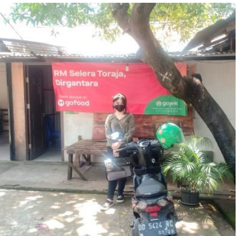
Pengambilan Data Kecamatan Panakkukang