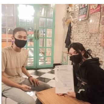
Pengambilan Data Kecamatan Tamalanrea