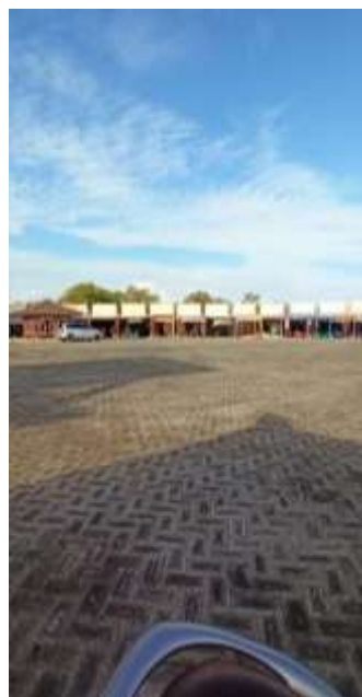
Warung Makan di Pantai Marina