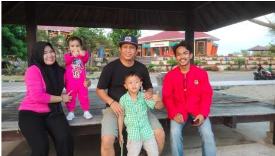
Foto Bersama Responden