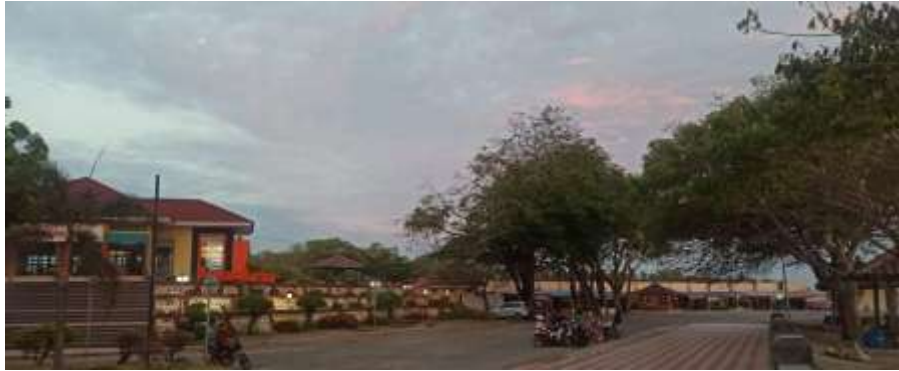
Fasilitas di Pantai Marina