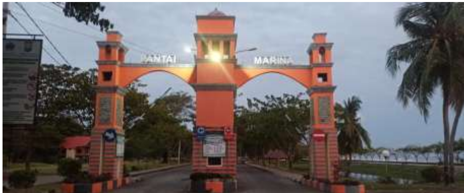
Tempat masuk Wisata Pantai Marina