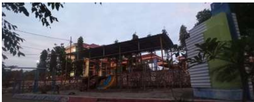
Fasilitas di Pantai Marina