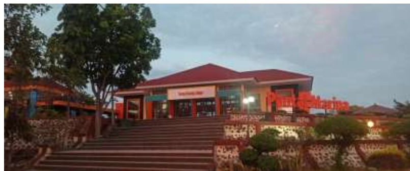
Penginapan di Pantai Marina