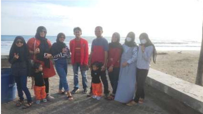
Foto Bersama Responden