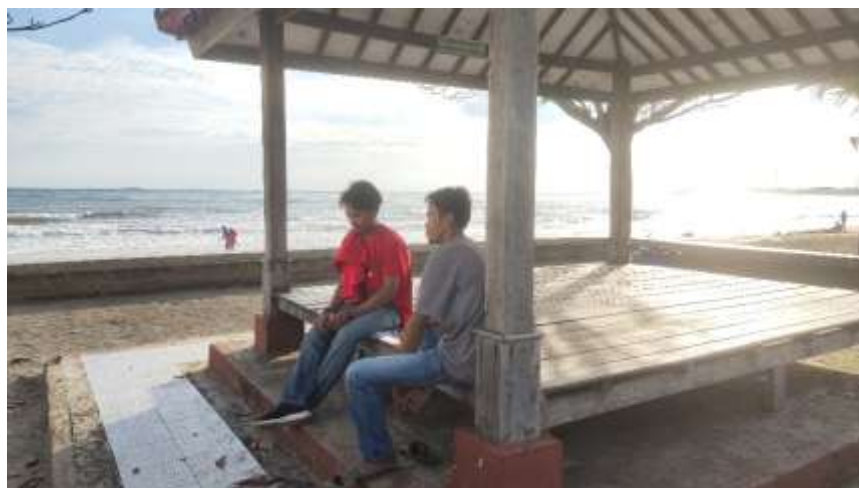
Foto Bersama Responden