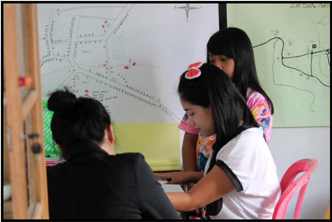
Wawancara dengan informan kunci (Bidan)