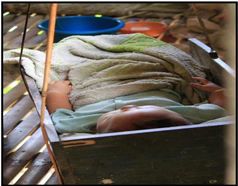
Bayi ditidurkan dalam ayunan