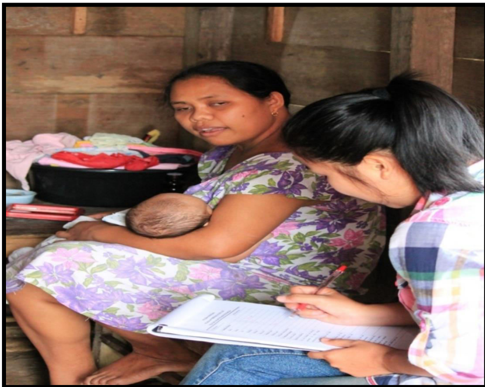
Informan sedang menidurkan bayinya ketika diwawancara