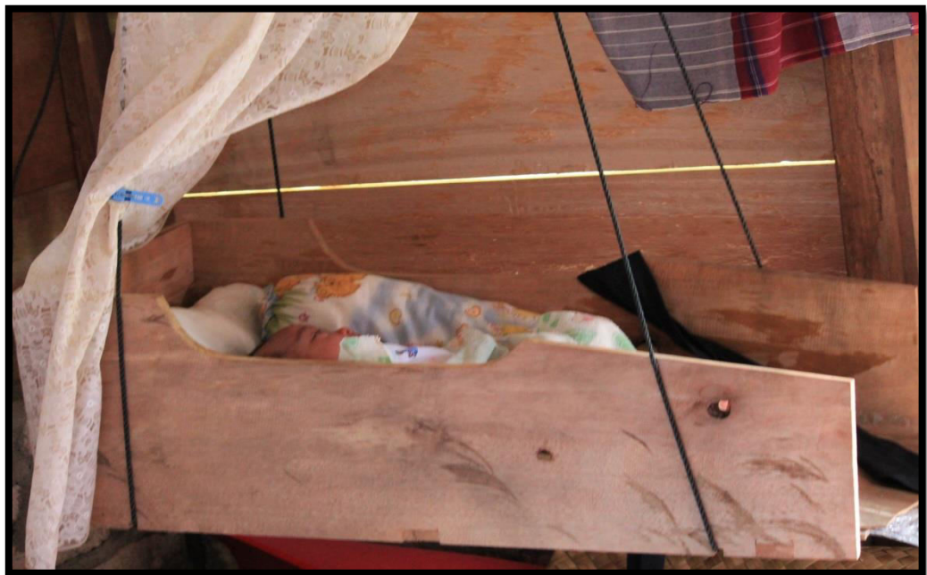
Bayi ditidurkan dalam ayunan