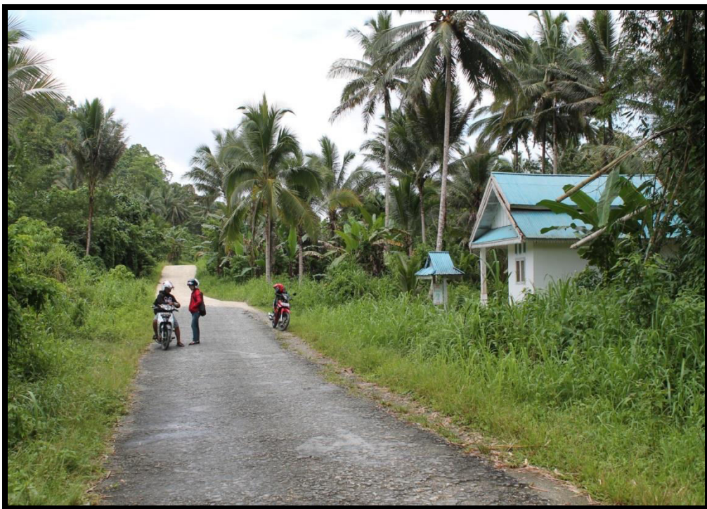
Sarana Pelayanan Kesehatan yang terletak jauh dari pemukiman penduduk