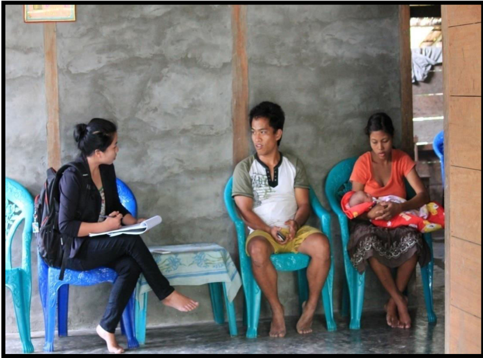
Wawancara dengan informan dan suami