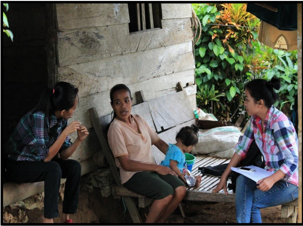
Pendamping peneliti menerjemahkan pertanyaan penelitian pada informan