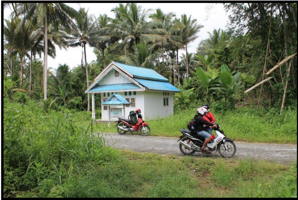
Sarana pelayanan kesehatan