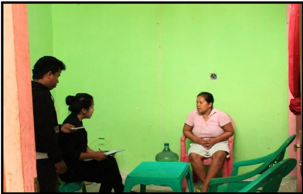
Wawancara dengan informan