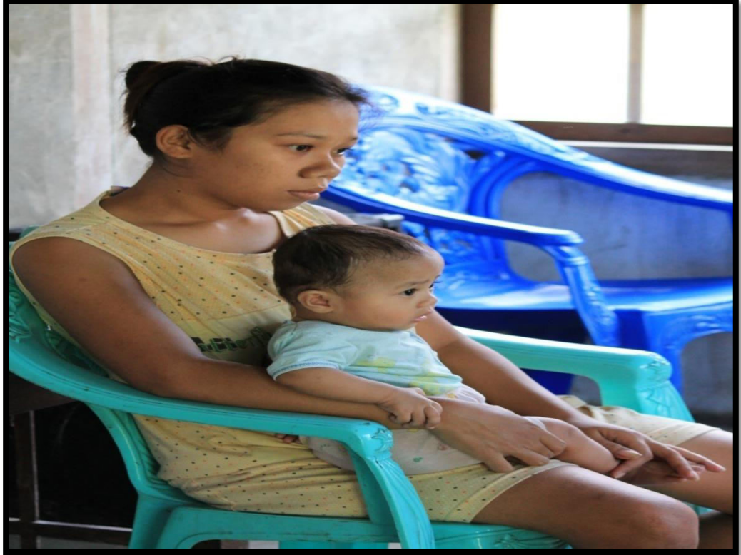
Informan dan bayinya