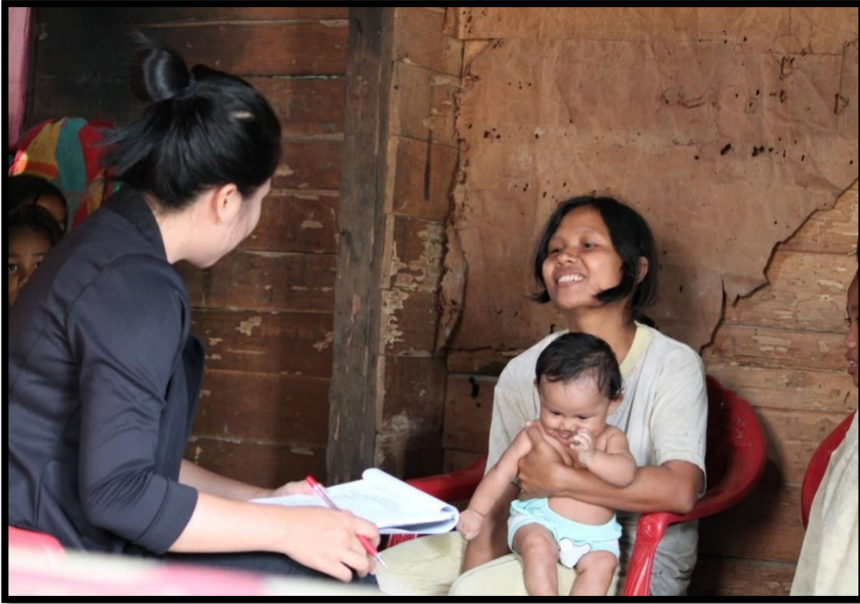
Wawancara dengan informan