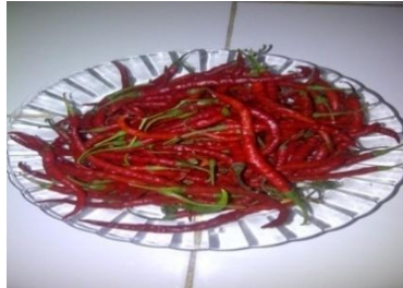
Gambar 10. Cabai merah keriting (setelah dipisahkan tangkai dan dicuci) dalam toples untuk proses fermentasi