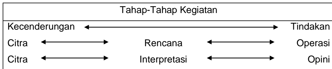
Gambar 1: Matriks kecenderungan dan tindakan (Dan Nimmo)

Teori pencitraan politik melihat bagaimana terjadinya proses pemahaman, penilaian, dan pengidentifikasian peristiwa, gagasan, tujuan, atau pemimpin politik (Nimmo, 2006; 7). Nimmo menggambarkan hubungan antara kecenderungan dan tindakan dalam matriks: