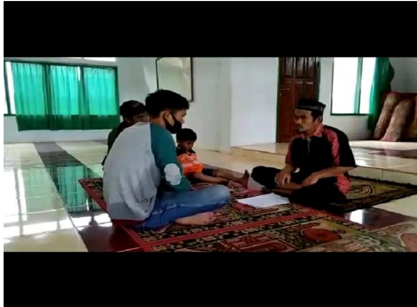
Foto Proses Pengucapan Dua Kalimat Shahadat Oleh Ketua DPD Hidayatullah Kab. Tana Toraja