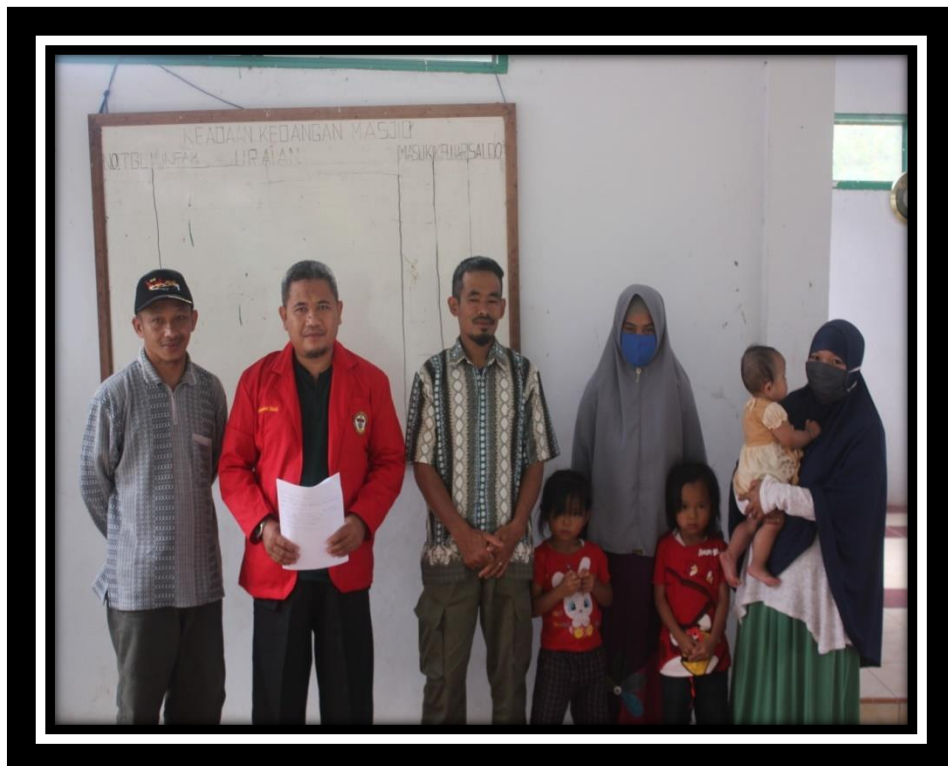
Foto Bersama Informan dan Kader