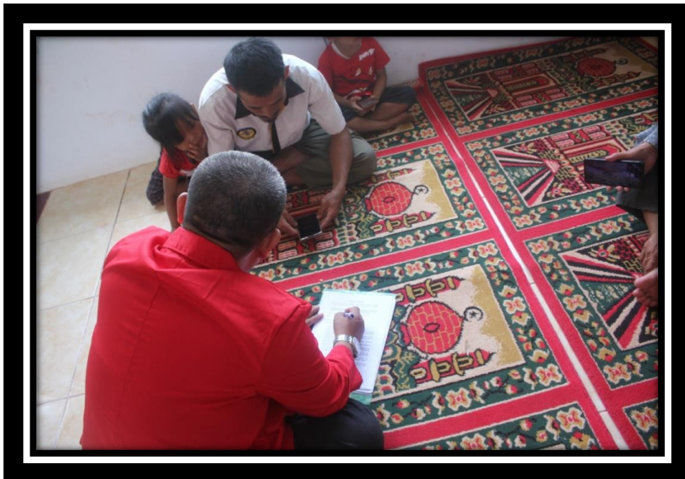
Wawancara Bersama Ketua Dpd Hidayatullah Toraja