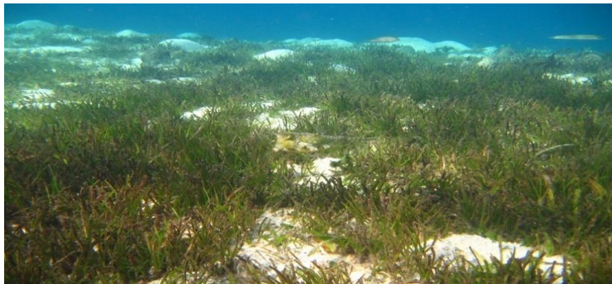
Gambar 2. Padang Lamun

faktor fisik dan kimia lainnya. Kadang terlihat pola penyebaran yang tidak merata dengan kepadatan yang relatif rendah dan bahkan terdapat semacam ruang-ruang kosong di tengahnya yang tidak tertumbuhi oleh lamun. Kadang terlihat pola penyebaran yang berkelompok-kelompok namun juga terdapat banyak pola yang merata tumbuh hampir pada seluruh garis pantai landai dengan kepadatan yang sedang dan bahkan tinggi. Banyak pula yang tumbuh dan menyebar secara alami dengan substrat dasar yang lunak (Kasim, 2005).