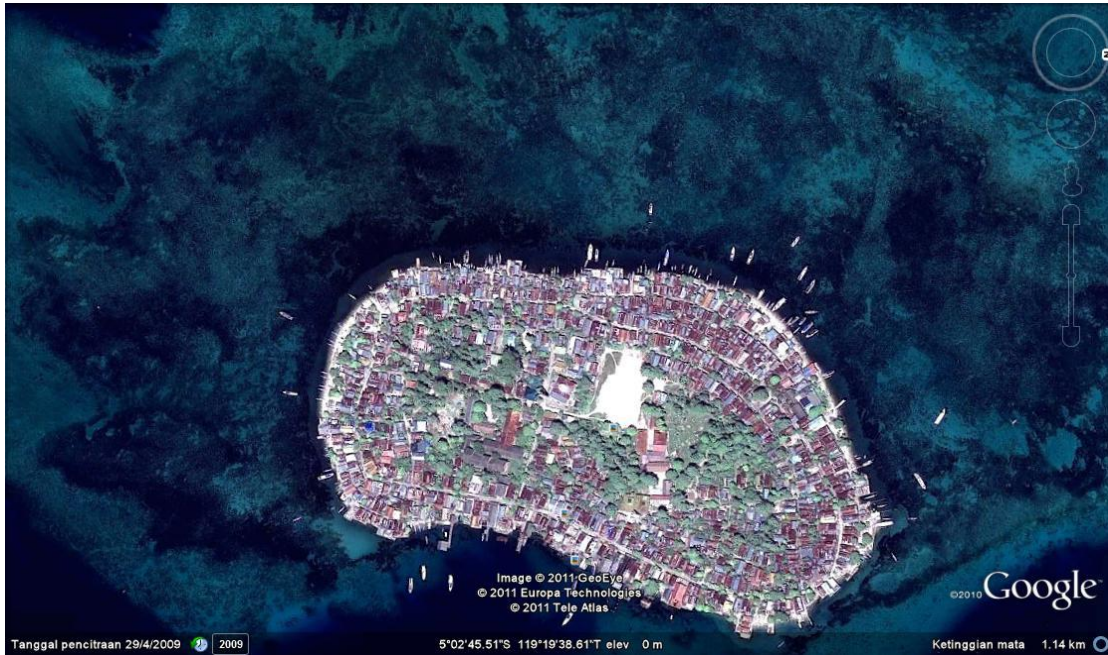
Gambar 3. Pulau Barrang Lompo

lamun dugong Thalassia hemprichii , lamun berujung bulat Cymodocea rotundata dan lamun sendok Halophila ovalis . Dari informasi beberapa warga diketahui bahwa lokasi stasiun ini merupakan daerah penangkapan ikan dengan cara membius dan membom, selain itu juga sering terjadi perubahan garis pantai setiap musim, namun hal ini terjadi bergantung pada tingginya pasang surut dan tingginya gelombang.