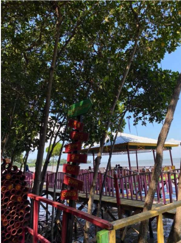
Salah satu prasarana gazebo yang tersedia di ekowisata mangrove