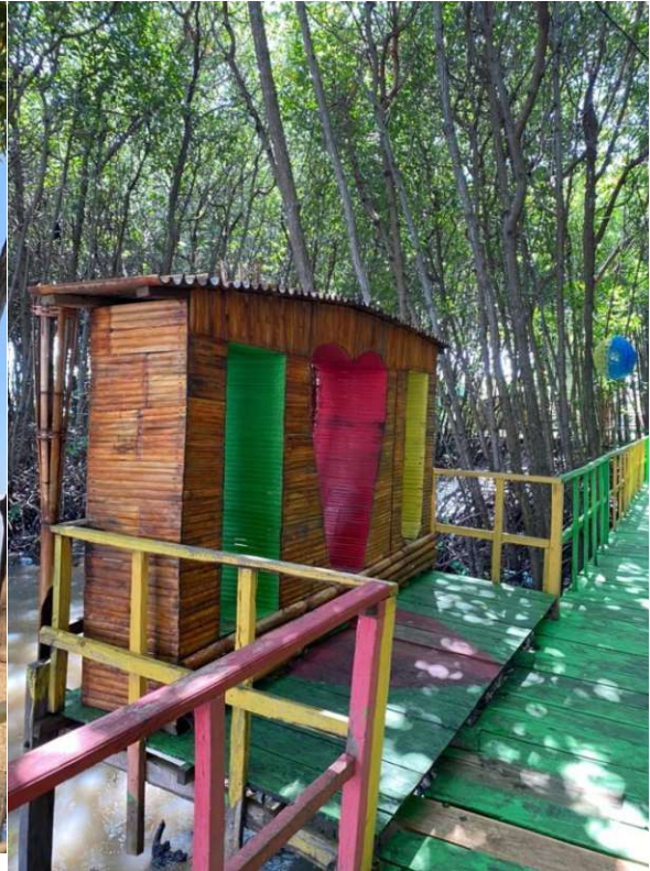
Salah satu spot foto yang tersedia di ekowisata mangrove