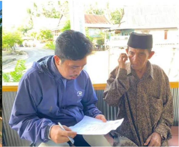
Pengambilan Data Responden