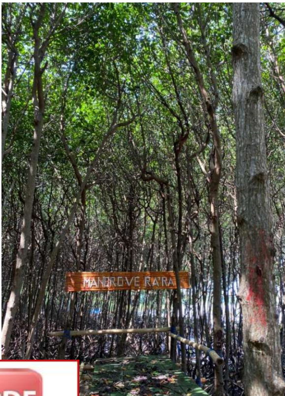
Salah satu spot foto yang tersedia di ekowisata mangrove