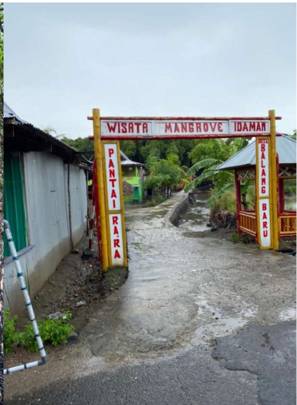
Gapura Ekowisata Mangrove di Desa Balang Baru