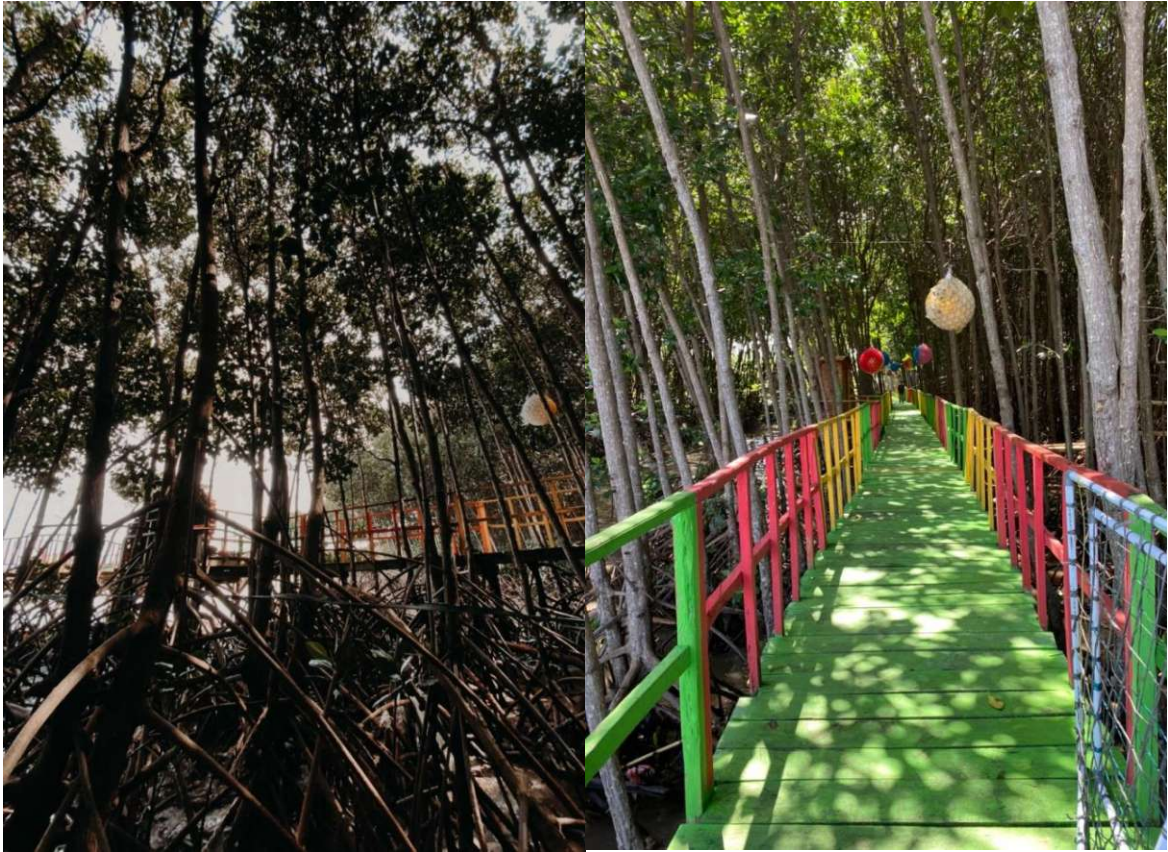
Mangrove di Desa Balang Baru