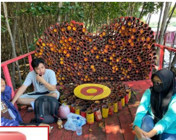
Diskusi bersama Pengelola Mangrove Tarawang