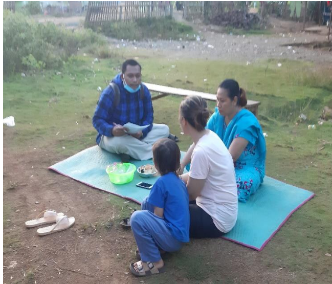
Gambar 3: Wawancara dengan informan