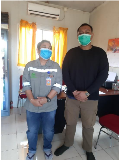
Gambar 1: Wawancara dengan informan