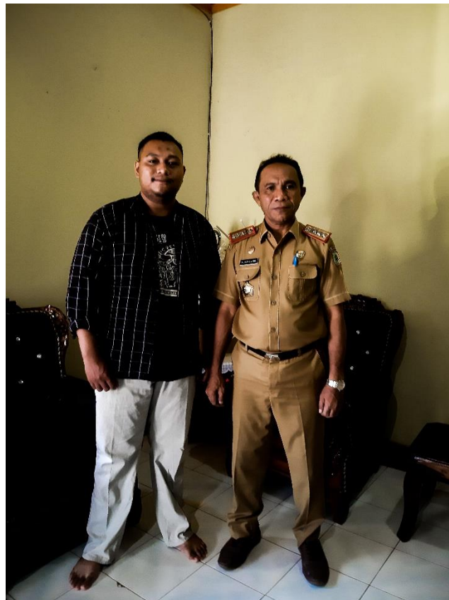
Gambar 4: Wawancara dengan informan