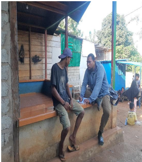
Gambar 2: Wawancara dengan informan