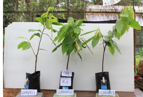
Gambar 2. Bibit kakao dengan Perlakuan m_1k_1