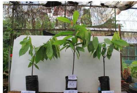
Gambar 6. Bibit kakao dengan Perlakuan m_2k_1