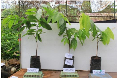
Gambar 3. Bibit kakao dengan Perlakuan m_1k_2