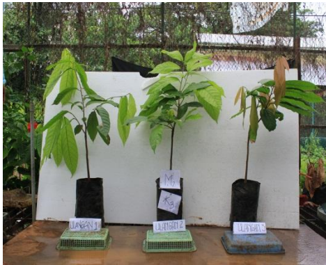
Gambar 7. Bibit kakao dengan Perlakuan m_2k_3