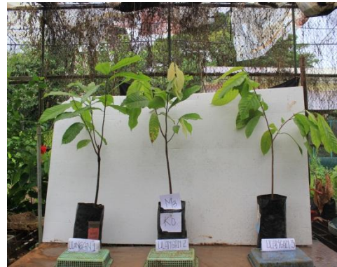
Gambar 8. Bibit kakao dengan Perlakuan m_3k_0