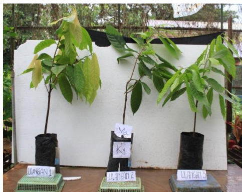
Gambar 9. Bibit kakao dengan Perlakuan m_3k_1