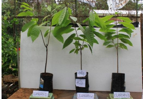
Gambar 1. Bibit kakao dengan Perlakuan m_1k_0