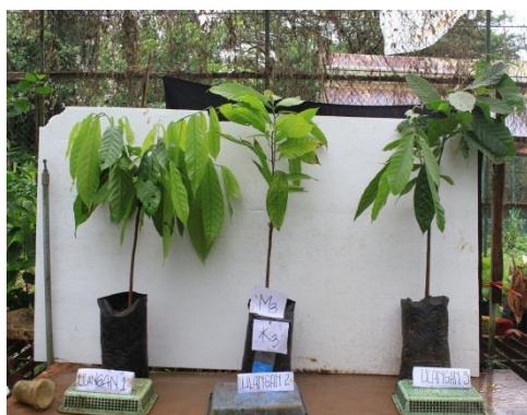
Gambar 11. Bibit kakao dengan Perlakuan m_3k_3