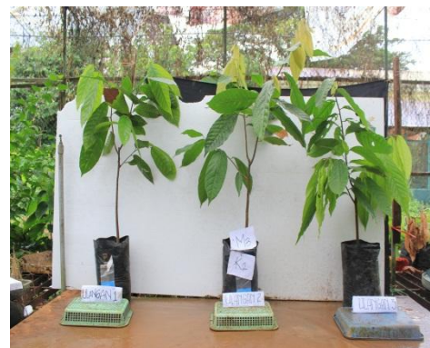
Gambar 10. Bibit kakao dengan Perlakuan m_3k_2