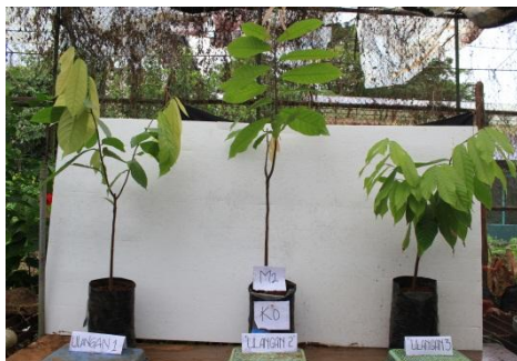
Gambar 5. Bibit kakao dengan Perlakuan m_2k_0