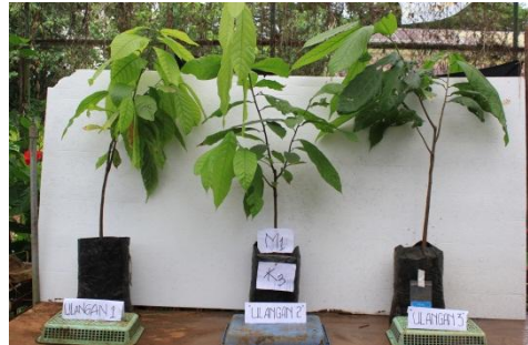
Gambar 4. Bibit kakao dengan Perlakuan m_1k_3