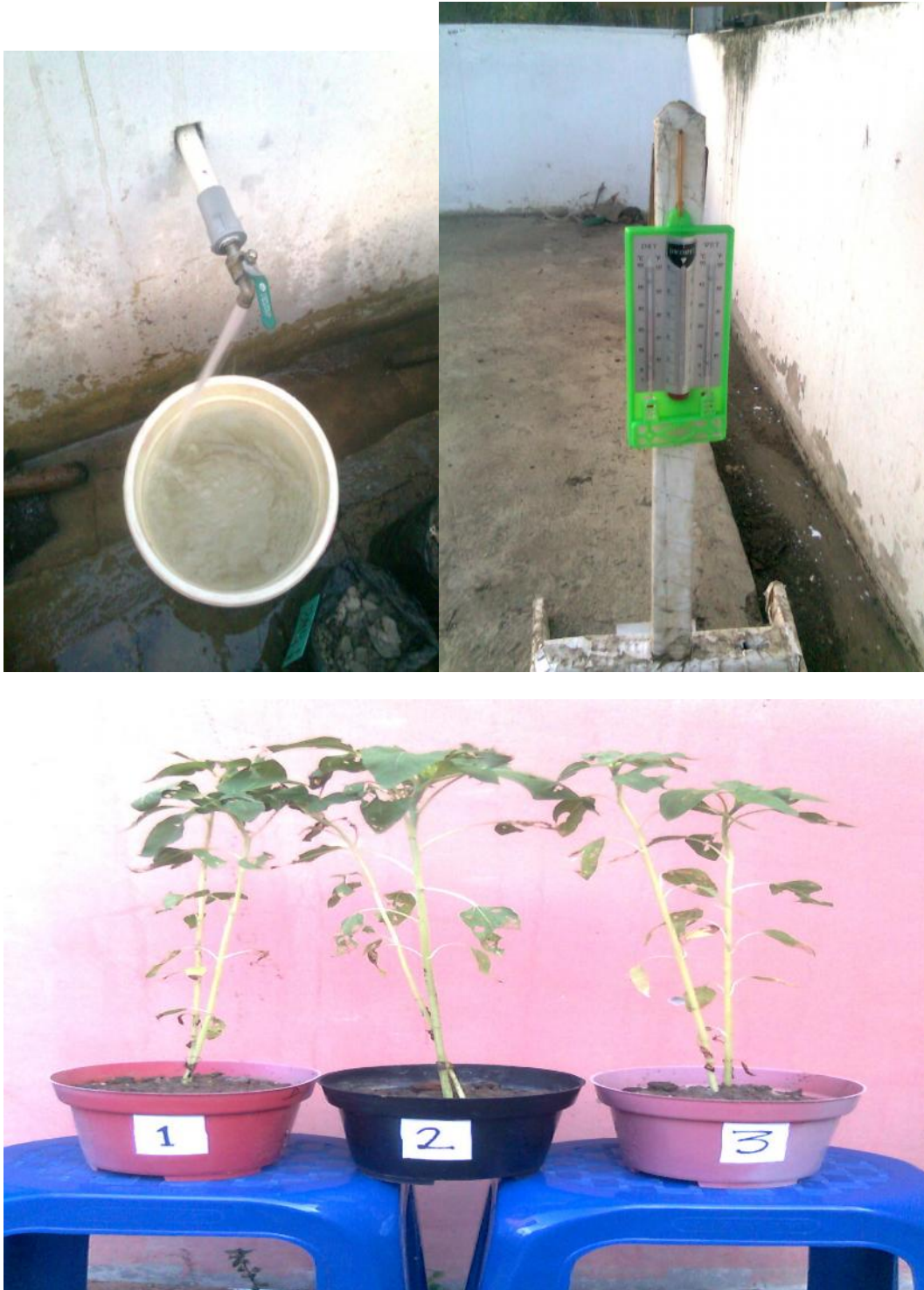
Gambar 8. Fasilitas air dan thermometer bola kering dan bola basah untuk pencatatan suhu udara rata-rata harian dan kelembaban udara dalam rumah kaca (Gambar atas). Tanaman bunga matahari berumur 2 bulan sebagai tanaman indikator untuk penentuan kadar air tanah pada titik layu permanen.