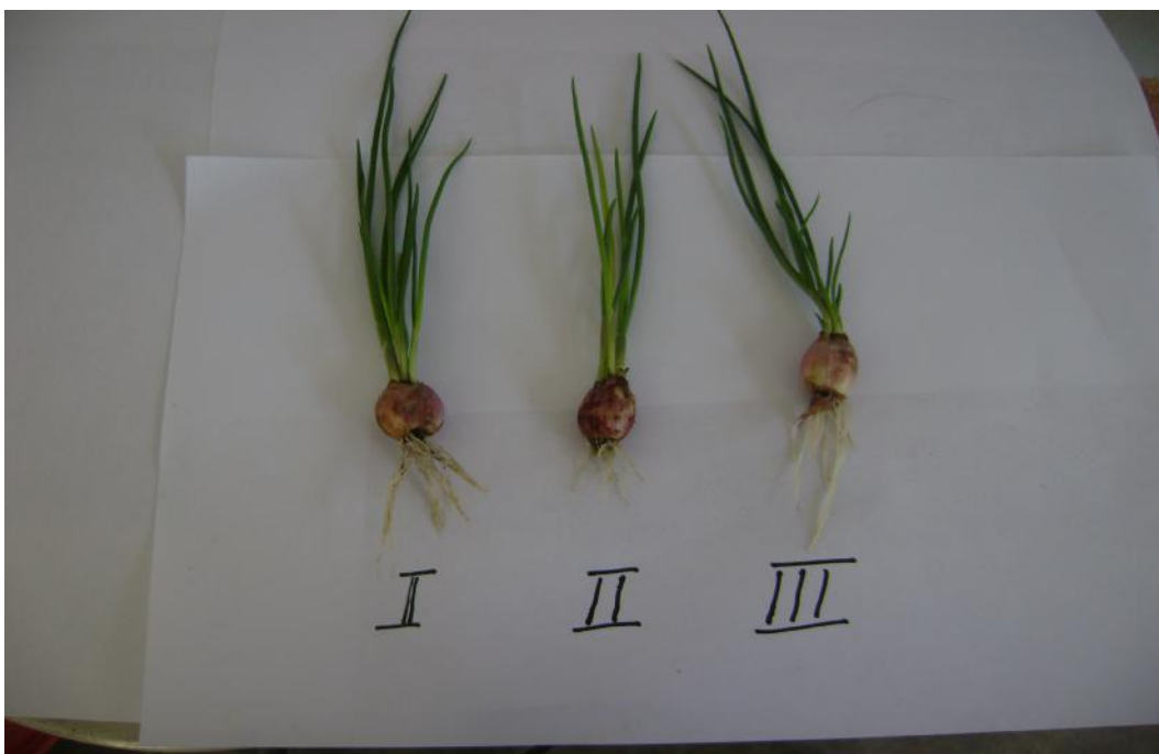
Gambar 11. Kondisi pertanaman percobaan ini 2 saat tanaman berumur 5 minggu setelah tanam (Gambar atas). Contoh tanaman saat berumur 2 minggu setelah tanam, rumawi I II dan III adalah Ulangan/kelompok. Contoh tanaman ini ditimbang (berat basah) untuk mengoreksi pemberian air setiap minggu.