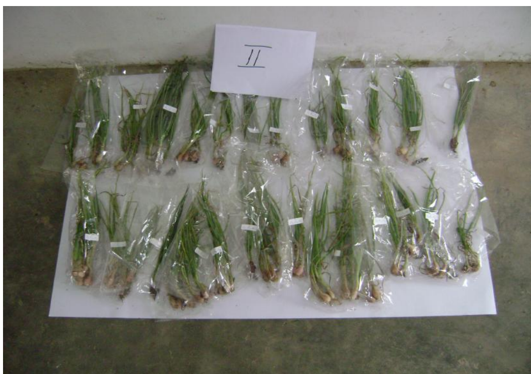
Gambar 16. Hasil Panen Ulangan I dan Ulangan II. Panen dilakukan tepat pada saat tanaman berumur 2 bulan (60 hari). Panen bawang lokal Palu pada umur ini hanya untuk keperluan konsumsi. Panen untuk keperluan benih dilakukan pada saat tanaman berumur 80-90 hari setelah tanam.