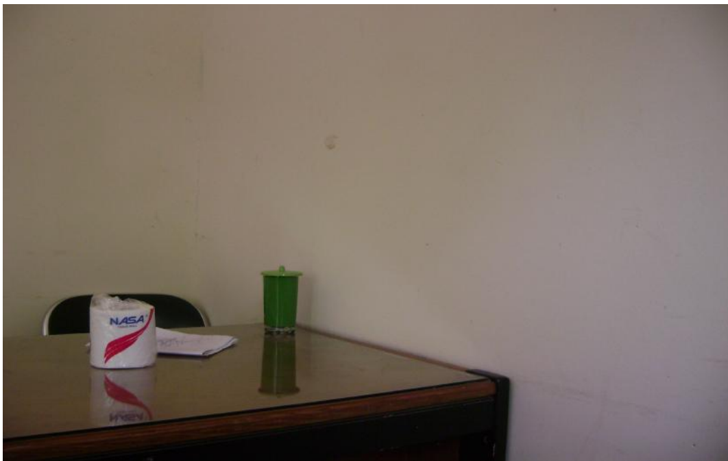
Gambar 7. Situasi dalam rumah kaca, tempat penelitian ini dilakukan. Tampak pintu menuju ruang penyiapan contoh tanah dan ruang kerja dalam rumah kaca (Gambar atas). Kondisi ruang kerja dalam rumah kaca (3x3 m) (Gambar bawah)