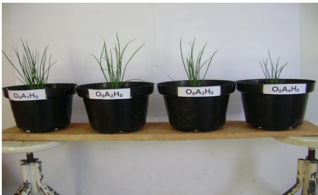
Gambar 15. Pengaruh persen Kadar Air Tersedia ( A_1 = 80-100\% , A_2 = 60-80\% , A_3 = 40-60\% dan A_4 = 20-40\% ) terhadap pertumbuhan tanaman bawang lokal Palu umur 3 minggu setelah tanam pada tanah asal Donggala Kodi (Gambar atas). dan tanah asal Watutela. Perlakuan A_1 , A_2 dan A_3 secara visual relatif sama pada ke dua lokasi tersebut (Gambar bawah)