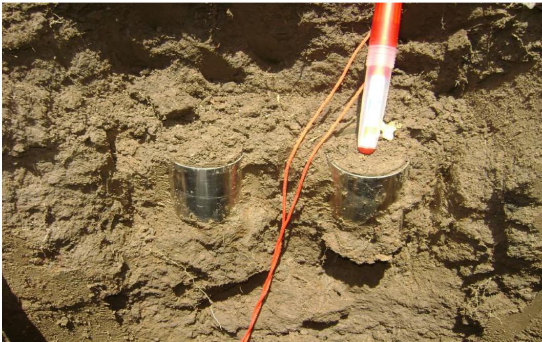
Gambar 5. Pengambilan contoh tanah tak terganggu untuk analisis sifat fisik tanah dan kadar air tanah pada kedalaman 10-20 cm (Gambar Atas). Pengambilan contoh tanah tak terganggu pada ke dalaman 40-50 cm (Gambar bawah). Pengambilan contoh tanah tak terganggu juga dilakukan pada ke dalaman antara 60-90 cm.