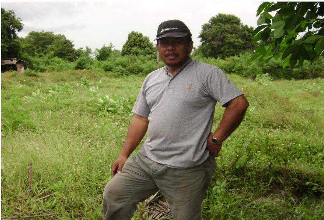
Gambar 1. Survei lapangan pada salah satu lokasi potensial untuk dikembangkan (Sistem Lahan PLU), merupakan areal persawahan yang kurang fungsional karena keterbatasan air irigasi (Desa Pombewe, 15-20 m dpl)