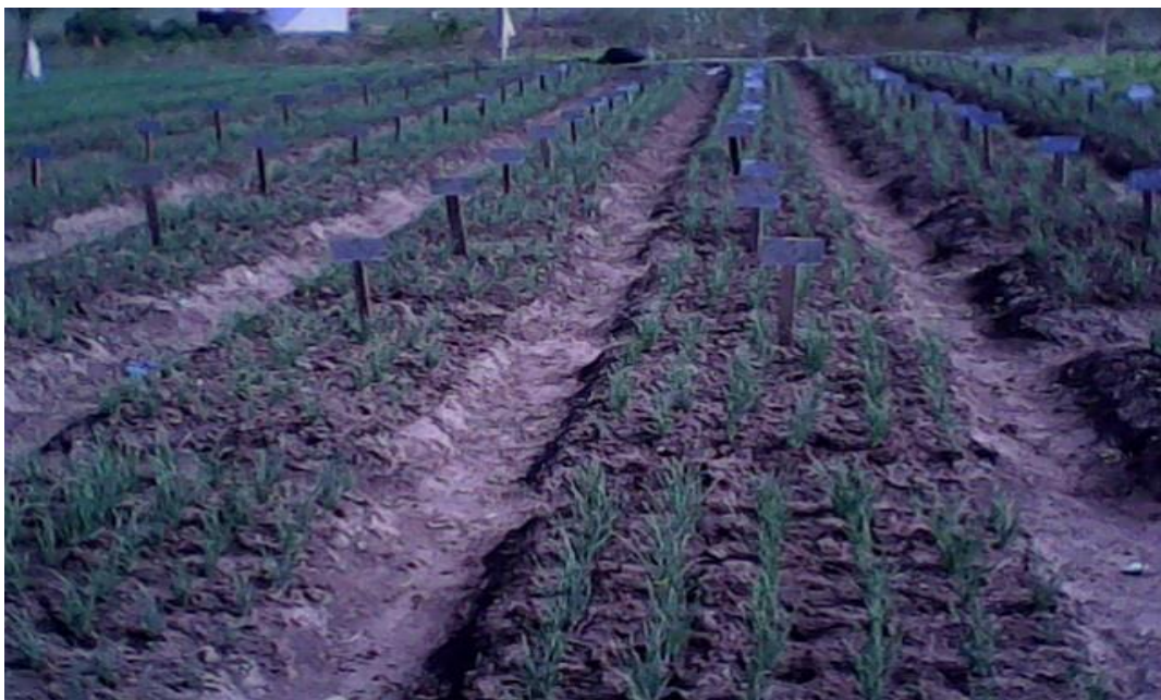
Gambar 19. Percobaan lapangan pada saat tanaman berumur 3 minggu setelah tanam (Gambar diambil pada tanggal 12 Mei 2011)