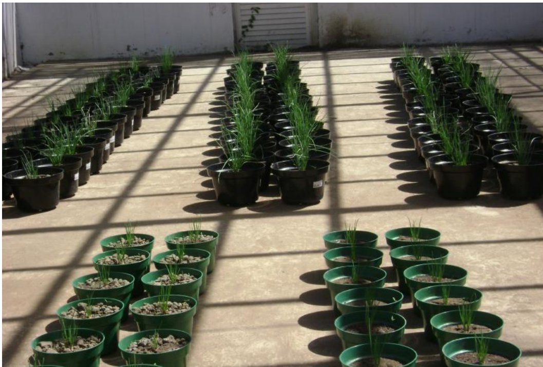
Gambar 10. Kondisi tanaman pada saat berumur 3 minggu setelah Tanam (Gambar atas, percobaan unit pertama). Kondisi tanaman saat berumur 6 minggu setelah tanam (fase generatif). Tampak pula sebagian percobaan unit kedua (pot warna hijau) pada saat tanaman berumur 2 minggu setelah tanam (Gambar bawah)