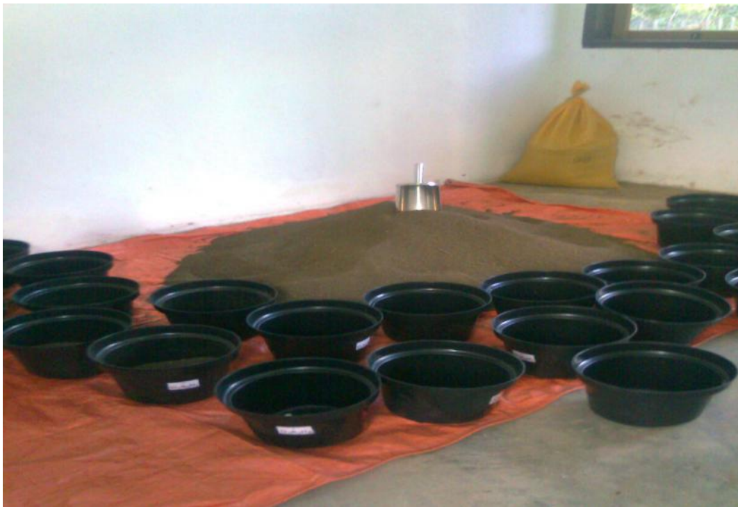
Gambar 6. Contoh tanah lolos saringan 2 mm dari 3 sistem lahan, disiapkan dalam ruang penyiapan contoh tanah di rumah kaca (Gambar atas). Pengisian contoh tanah ke dalam pot-pot percobaan yang telah diberi label untuk percobaan pot (Gambar bawah)