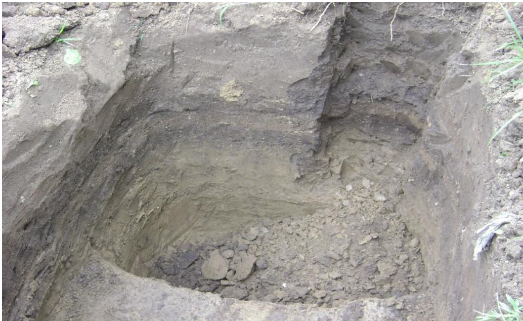
Gambar 2. Profil Perwakilan Pada Sistem Lahan PLU (Desa Pombewe). Solum tanah cukup dalam ( > 120 cm ) (Gambar atas). Tampak, posisi pengambilan contoh Tanah tak terganggu pada ke dalaman 10-20 cm, 40-60 cm dan 60- 80 cm (Gambar bawah)