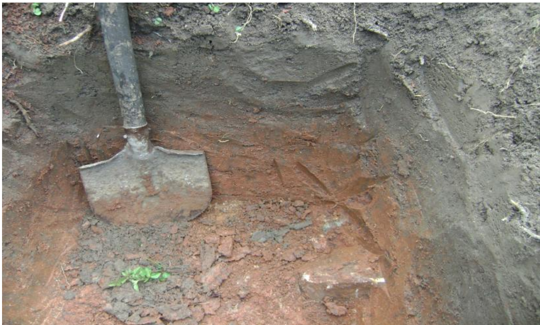
Gambar 3. Lokasi Penelitian Sistem Lahan (Desa Donggala Kodi , 233 m dpl). Merupakan areal persawahan dengan pola tanam padi-palawija/kacang-kacangan. Bawang lokal Palu memungkinkan masuk dalam pola tanam (Gambar Atas). Profil Tanah Desa Donggala Kodi, kedalaman efektif 73 cm (Gambar bawah). Air cukup tersedia di Lokasi ini.