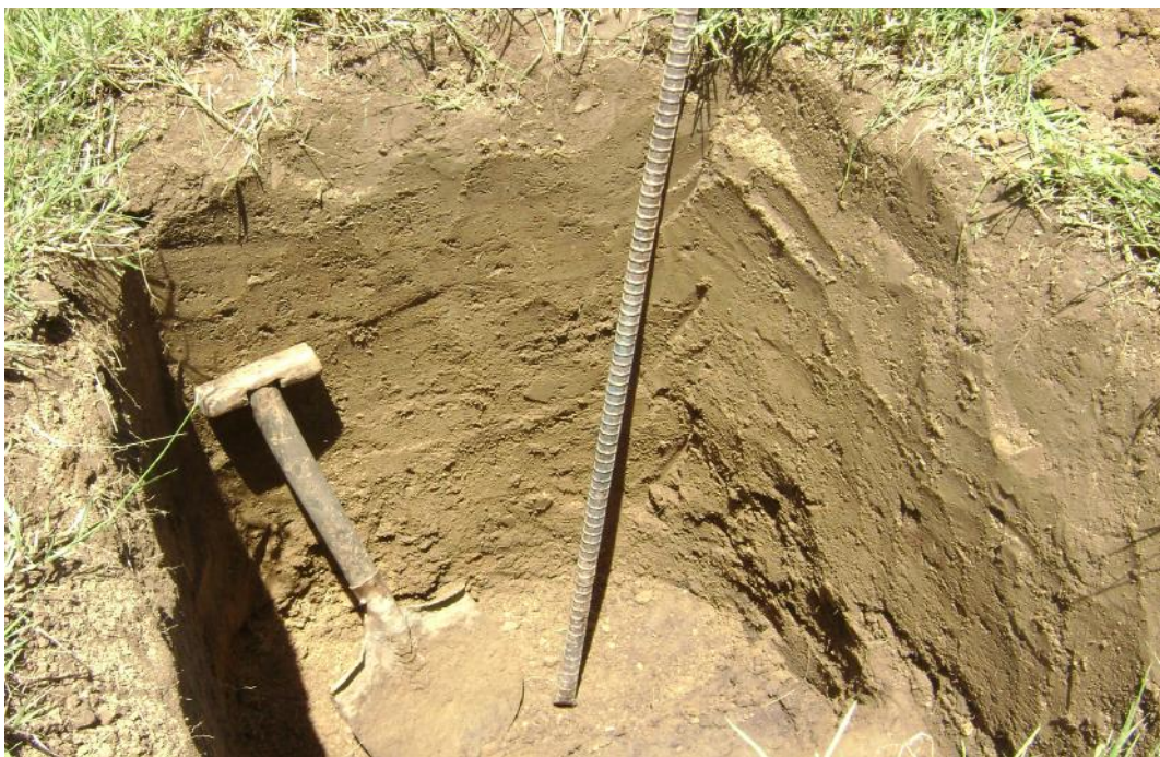
Gambar 4. Lokasi Penelitian pada lahan kering desa Watutella, terdapat sumber air permukaan yang relatif terbatas untuk pengairan (gambar atas). Kondisi tanah cukup baik, solum tanah cukup dalam ( > 1 m) (Gambar bawah)