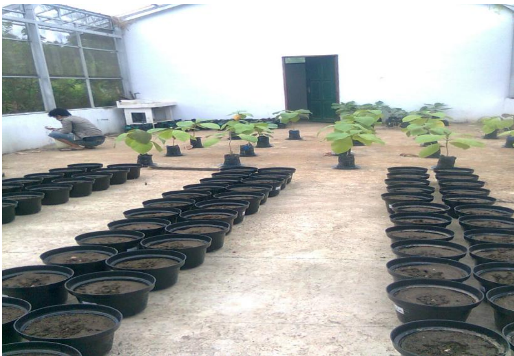
Gambar 9. Pot-pot percobaan berisi tanah (5kg) dalam kondisi kapasitas lapang dan siap untuk ditanami (Gambar atas). Pot percobaan setelah benih bawang lokal Palu ditanam (Gambar Bawah)