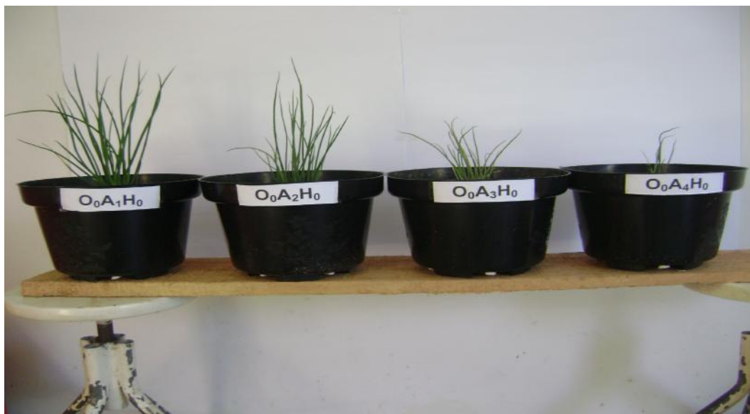
Gambar 14. Contoh tanaman untuk koreksi pemberian air pada sistem lahan (Donggala Kodi)(Gambar atas). Pengaruh persen Kadar Air Tersedia ( A_1 = 80-100\% , A_2 = 60-80\% , A_3 = 40-60\% dan A_4 = 20-40\% ) terhadap pertumbuhan tanaman bawang lokal Palu umur 3 minggu setelah tanam pada tanah asal Pombewe. Pertumbuhan Tanaman secara visual cenderung menurun dengan menurunnya kadar air tanah (Gambar bawah)