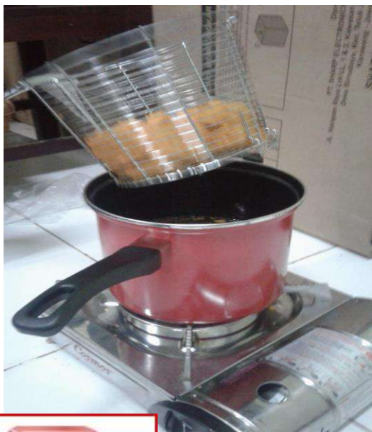
Pengaliran nugget dangke