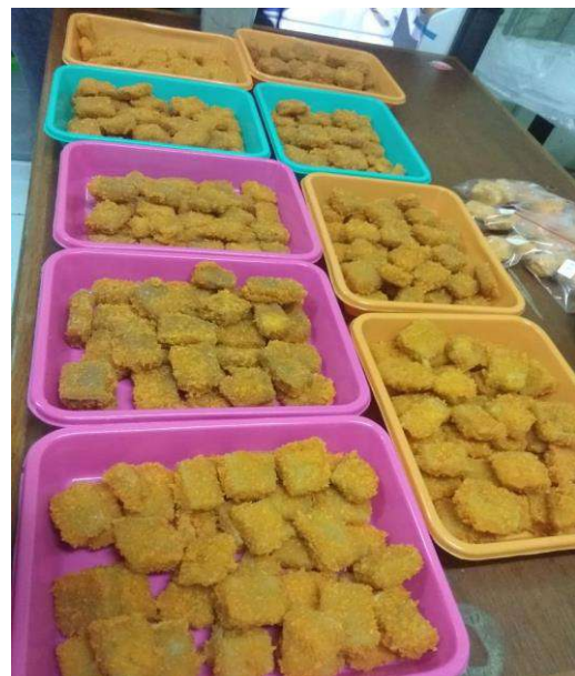
Nugget dangke yang sudah di goreng