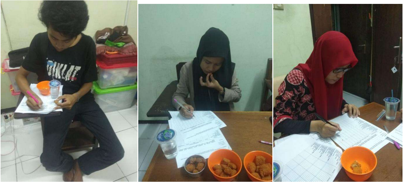
Kegiatan Uji Organoleptik