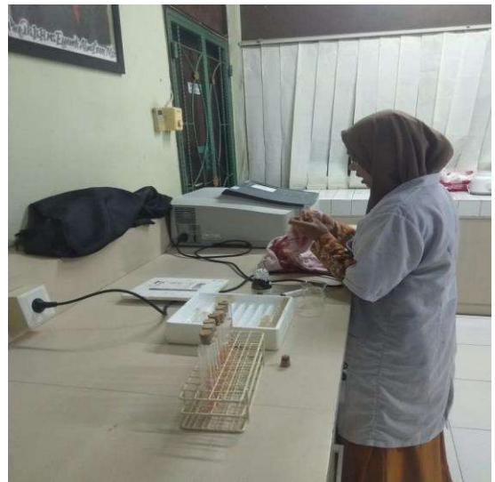
Uji TBA dengan Spektrofotometer