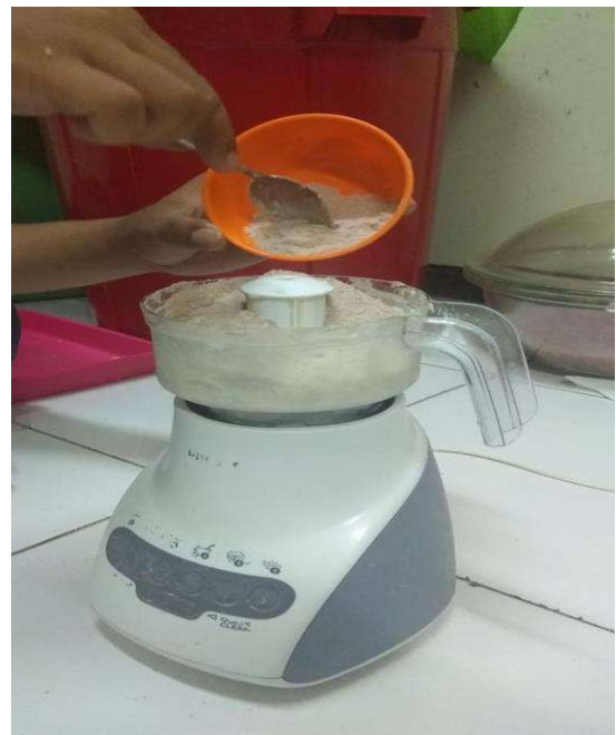
Pencampuran bahan nugget dangke