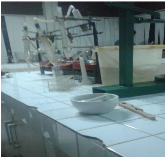
Destilasi sampel nugget dangke