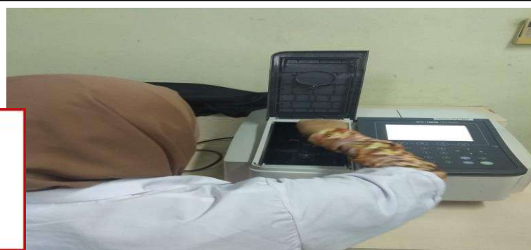
Uji TBA dengan Spektrofotometer