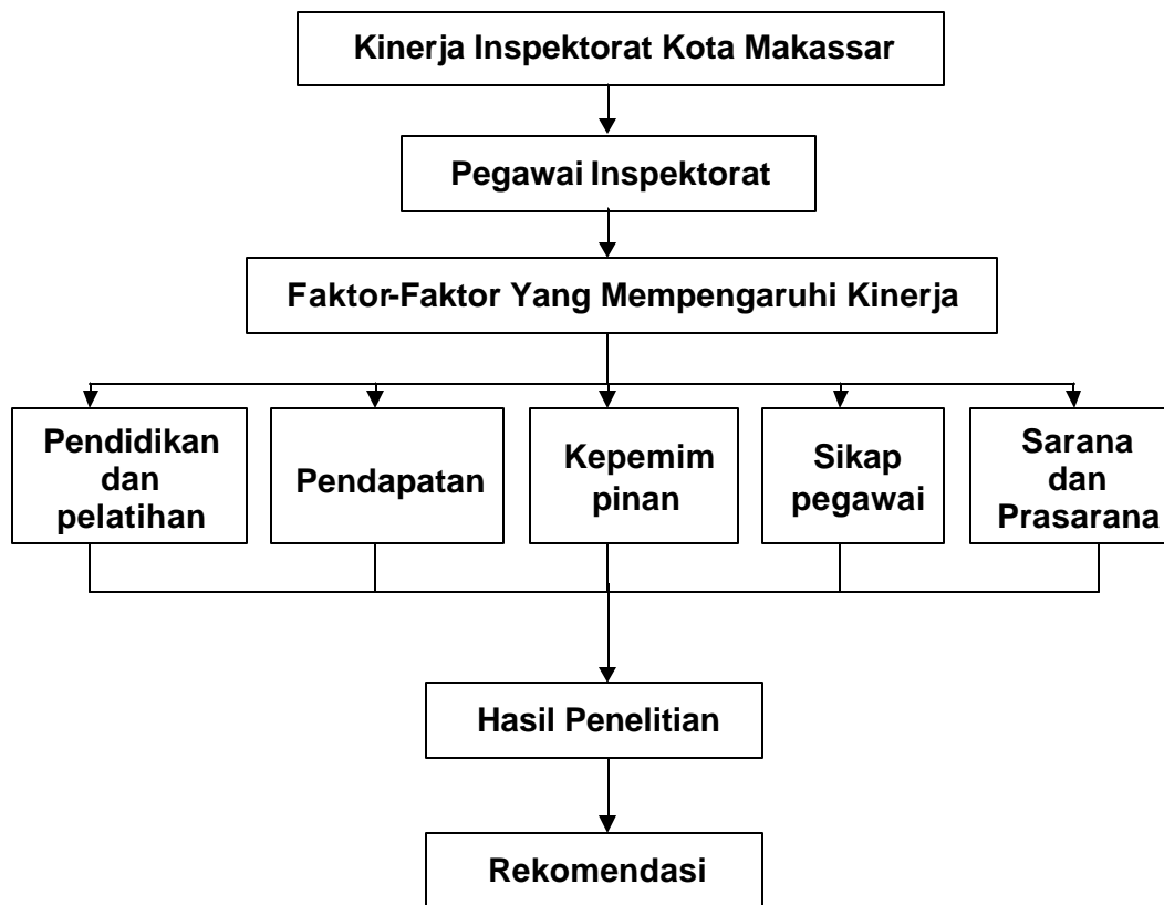
Gambar 1. Skema Kerangka Pikir