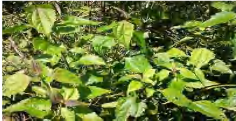
Gambar 2. Jonga-Jonga (Enalgattuso, 2015)

mampu meningkatkan ketersediaan unsur hara dalam tanah. Bentuk dari jonga-jonga dapat dilihat pada Gambar 2.