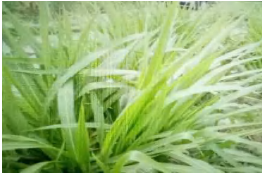
Gambar 1. Rumput gajah mini (Dokumentasi penelitian, 2018)

Rumput gajah mini atau biasa disebut dwarf elephant grass merupakan jenis rumput unggul yang mempunyai produktivitas yang tinggi dan kandungan nutrisi yang cukup baik. Kultivar ini memiliki karakteristik perbandingan rasio daun yang tinggi dibandingkan batang. Kualitas nutrisi rumput ini lebih tinggi pada berbagai tingkat usia dibandingkan jenis rumput tropis lainnya. Selain itu, rumput gajah mini mempunyai keunggulan antara lain tahan kekeringan, dan hanya bisa di propagasi melalui metode vegetatif, zat gizi yang cukup tinggi serta memiliki palatabilitas yang tinggi bagi ternak ruminansia (Lasamadi dkk., 2013). Rumput gajah mini dapat dilihat pada Gambar 1.