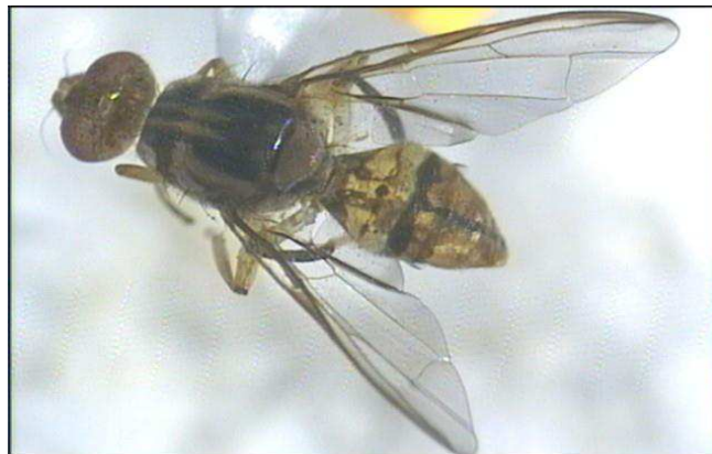
Gambar 13. Bactrocera