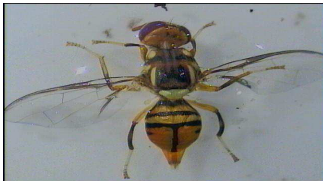
Gambar 12. Bactrocera Carambolae