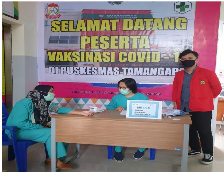
Foto bersama pegawai pemeriksa vaksinasi Covid-19