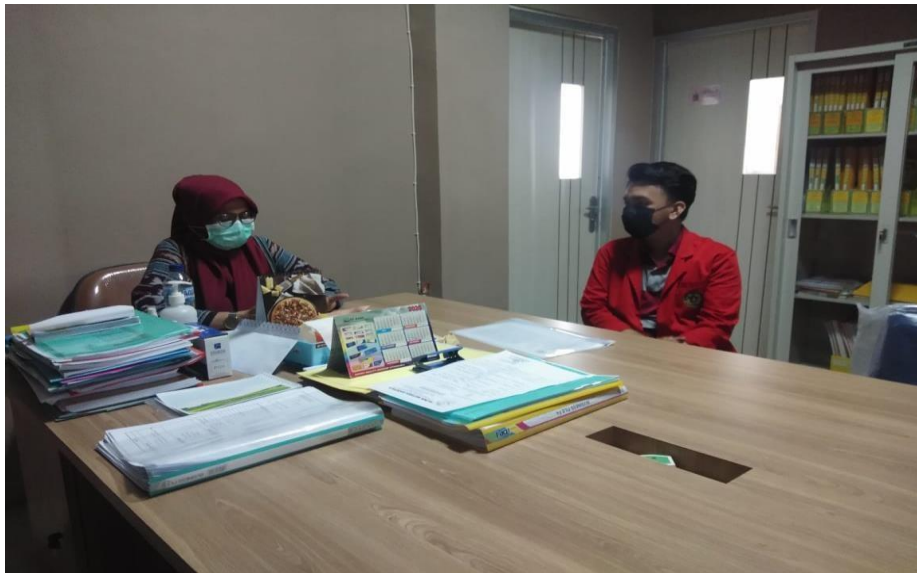
wawancara dengan Kepala PUSKESMAS Tamangapa Kota Makassar