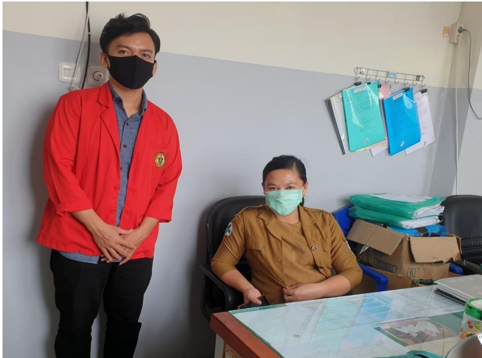
Berfoto bersama Kepala Bidang Poli PUSKESMAS Tamangapa