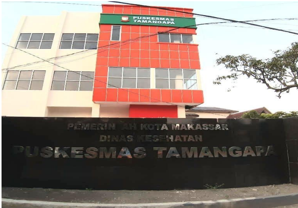
Foto Bangunan Puskesmas Tamangapa Kota Makassar