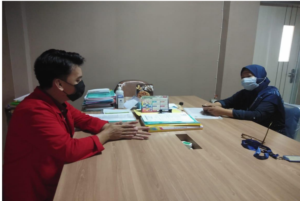
Wawancara dengan Kepala Bidang Koperasi PUSKESMAS Tamangapa