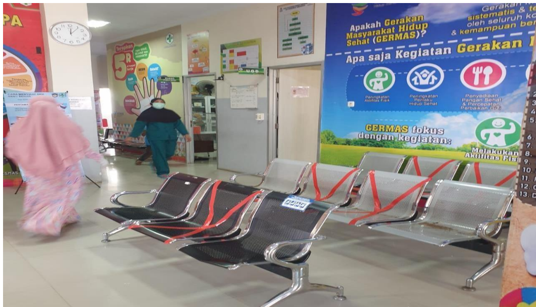
Suasana Ruang Tunggu Pasien Puskesmas