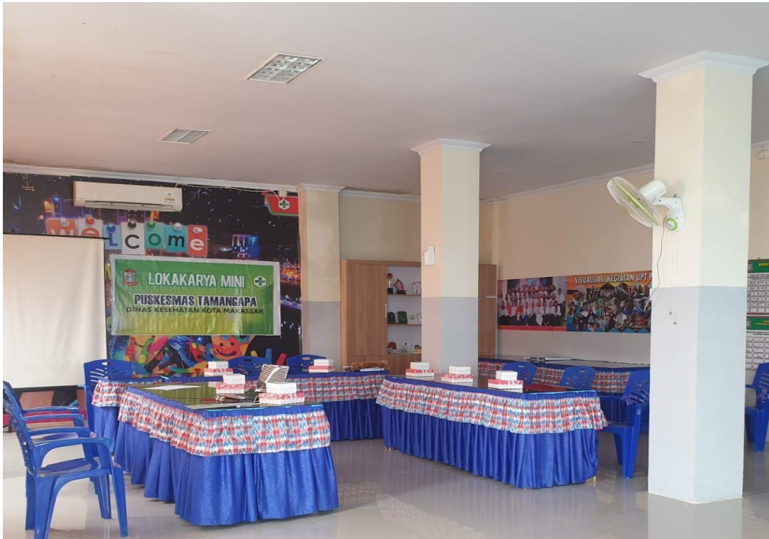
Ruang rapat Puskesmas Tamangapa Kota Makassar