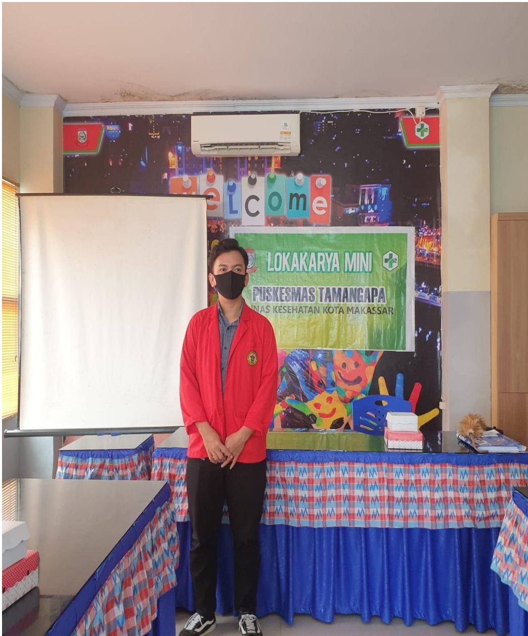
Sedang memperkenalkan diri dan memaparkan tujuan melakukan penelitian