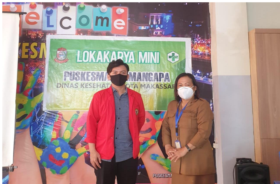
Foto bersama Kepala Sub Bagian Tata Usaha PUSKESMAS Tamangapa