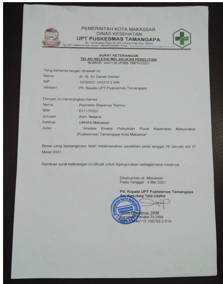
Surat Keterangan Telah Selesai Melakukan Penelitian