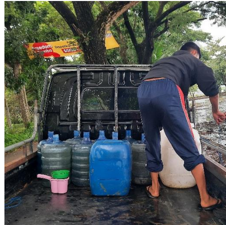
Gambar 2. Pengambilan Air Baku