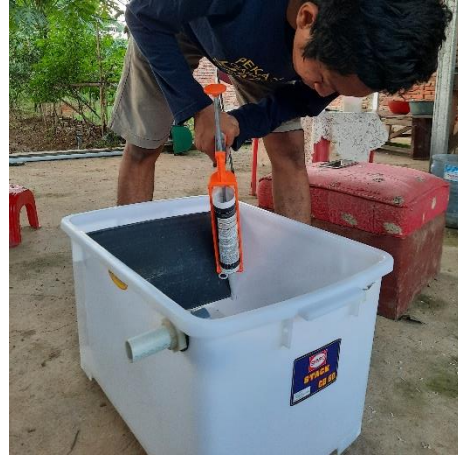
Gambar 1. Perancangan Alat