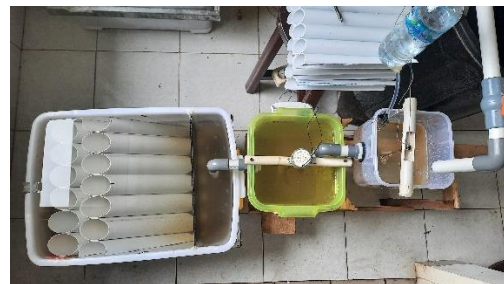
Gambar 3. Pengujian Alat