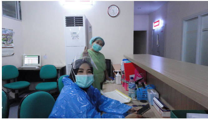
Kantor Depan Ruang Bersalin