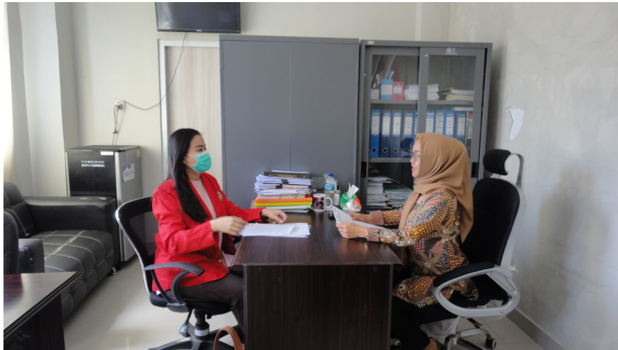
Kepala Seksi Keperawatan