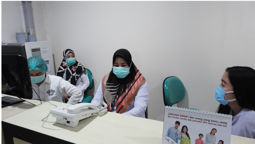
Petugas bagian IGD