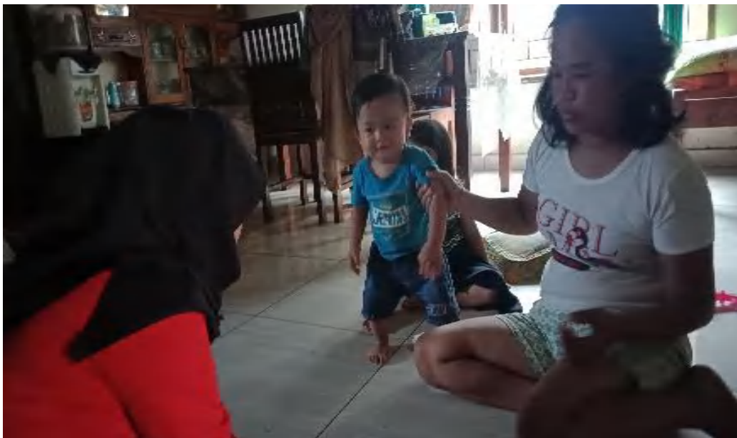
Gambar 4 Wawancara responden di Kelurahan Bulu Tempe Desa Welalang'e