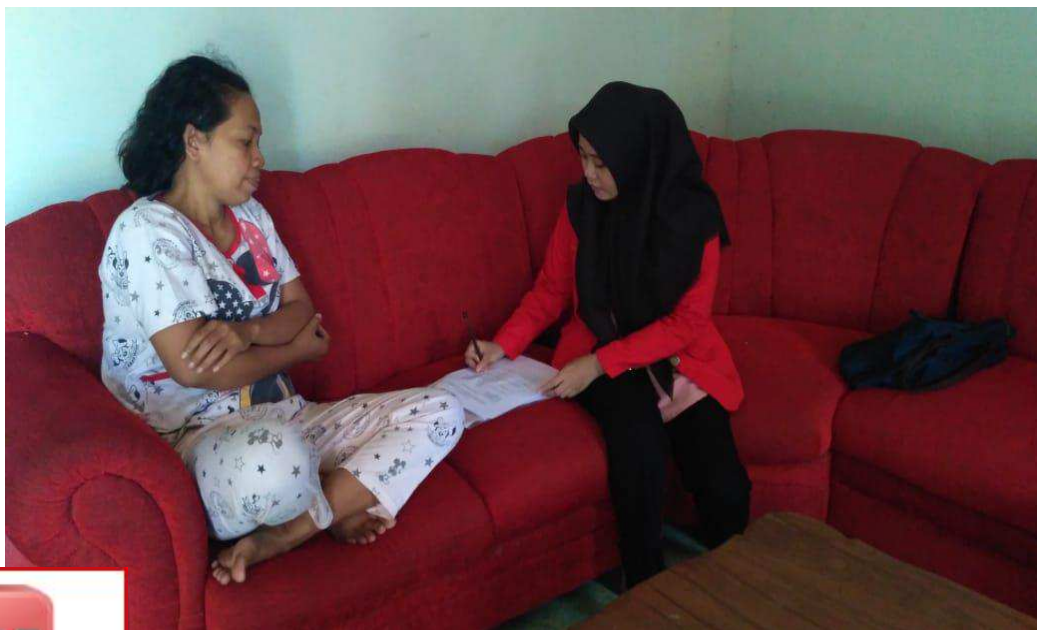
Gambar 2 Wawancara responden di Kelurahan Mattiro Walie