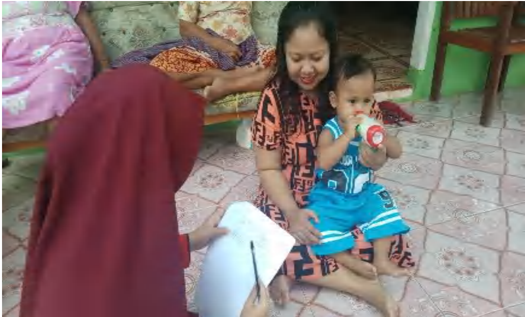
Gambar 3 Wawancara responden di Kelurahan Macanang