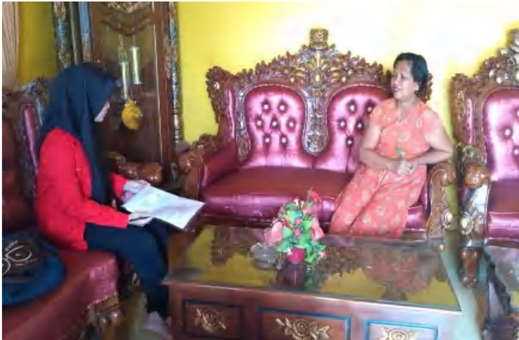
Gambar 1 Mengunjungi kader posyandu di Kelurahan Bulu Tempe