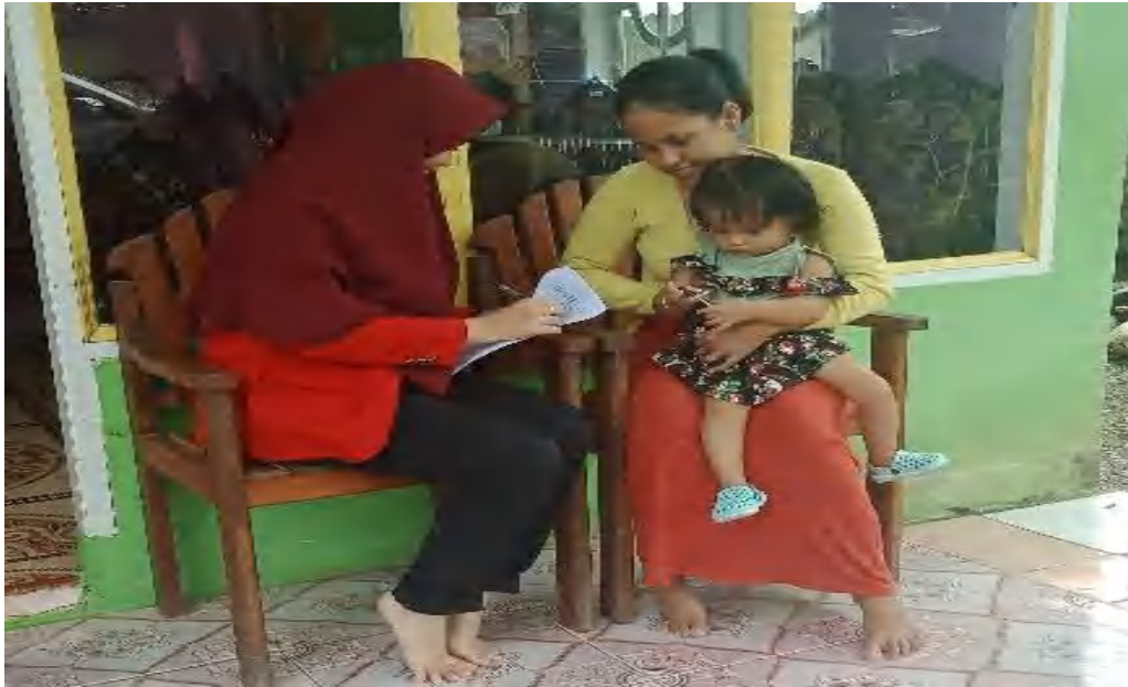
Gambar 5 Wawancara responden di Kelurahan Macanang