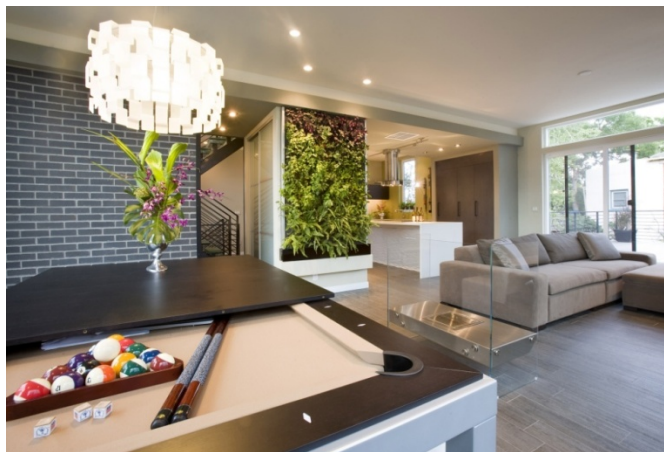
Gambar 4 Living Walls