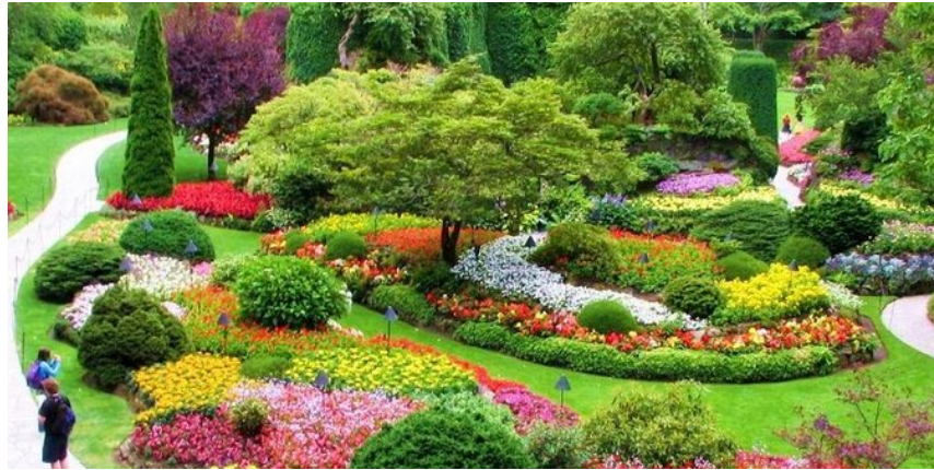
Gambar 1 Taman