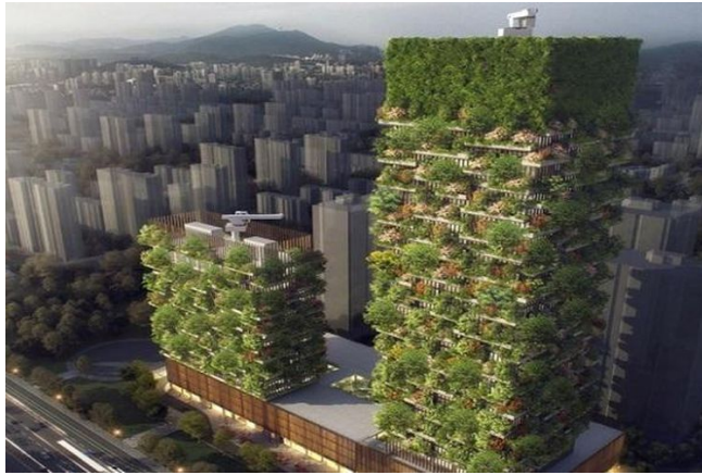
Gambar 7 Bosco Verticale