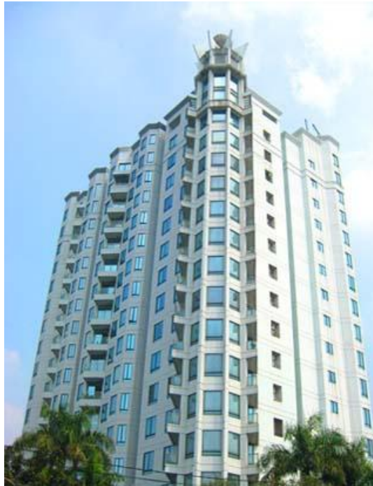
Gambar 9 Apartemen Permata Gandaria