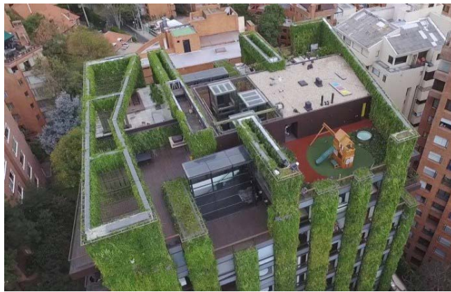
Gambar 6 Edificio Santalaia

Edificio Santalaia, saat ini dianggap sebagai 'jantung hijau Bogota' dan sebagai ikon kesinambungan serta peringatan tentang peran penting tumbuhan terhadap kehidupan sehari-hari warga.