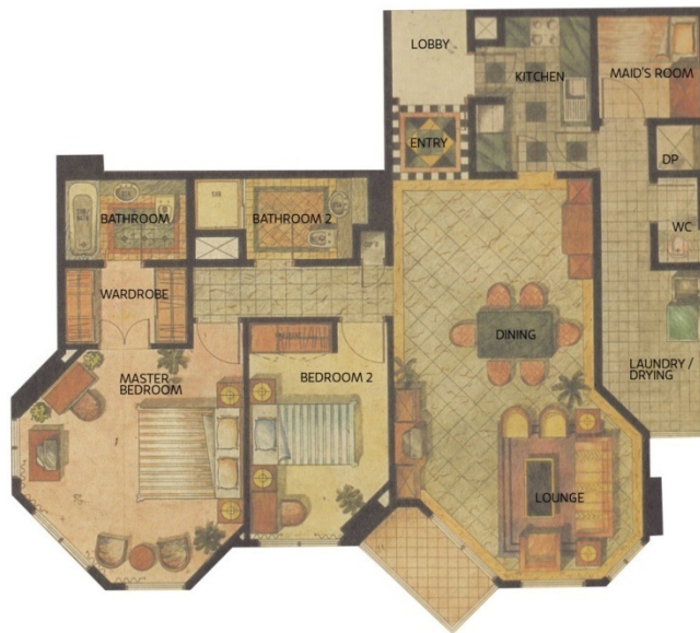
Gambar 10 Denah Unit 2 Kamar Tidur