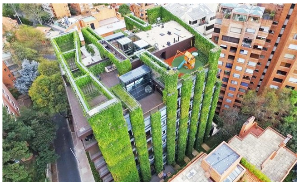
Gambar 5 Edificio Santalaia

Edificio Santalaia memiliki lebih 3.100 meter persegi tanaman yang meliputi bangunan 11 lantai, Edificio Santalaia, adalah taman vertikal terbesar di dunia. Dengan ukurannya yang masif, taman vertikal Santalaia bisa menghasilkan oksigen yang mencukupi untuk lebih dari 3.100 orang setiap tahun. Mampu memproses 774 kilogram logam berat, menyaring lebih dari 2.000 ton gas berbahaya, dan menangkap lebih dari 399 kilogram debu.