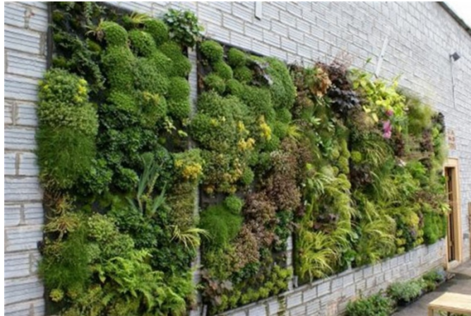
Gambar 2 Taman Vertikal