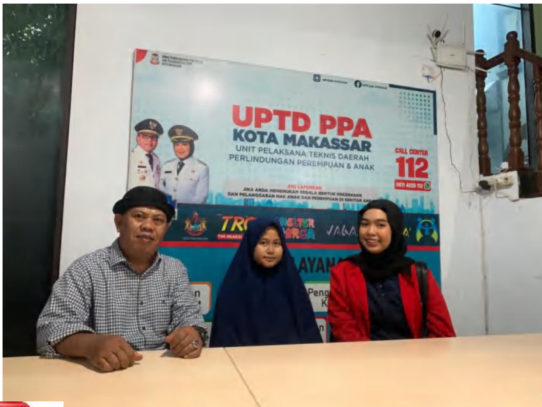
Foto Bersama Korban A