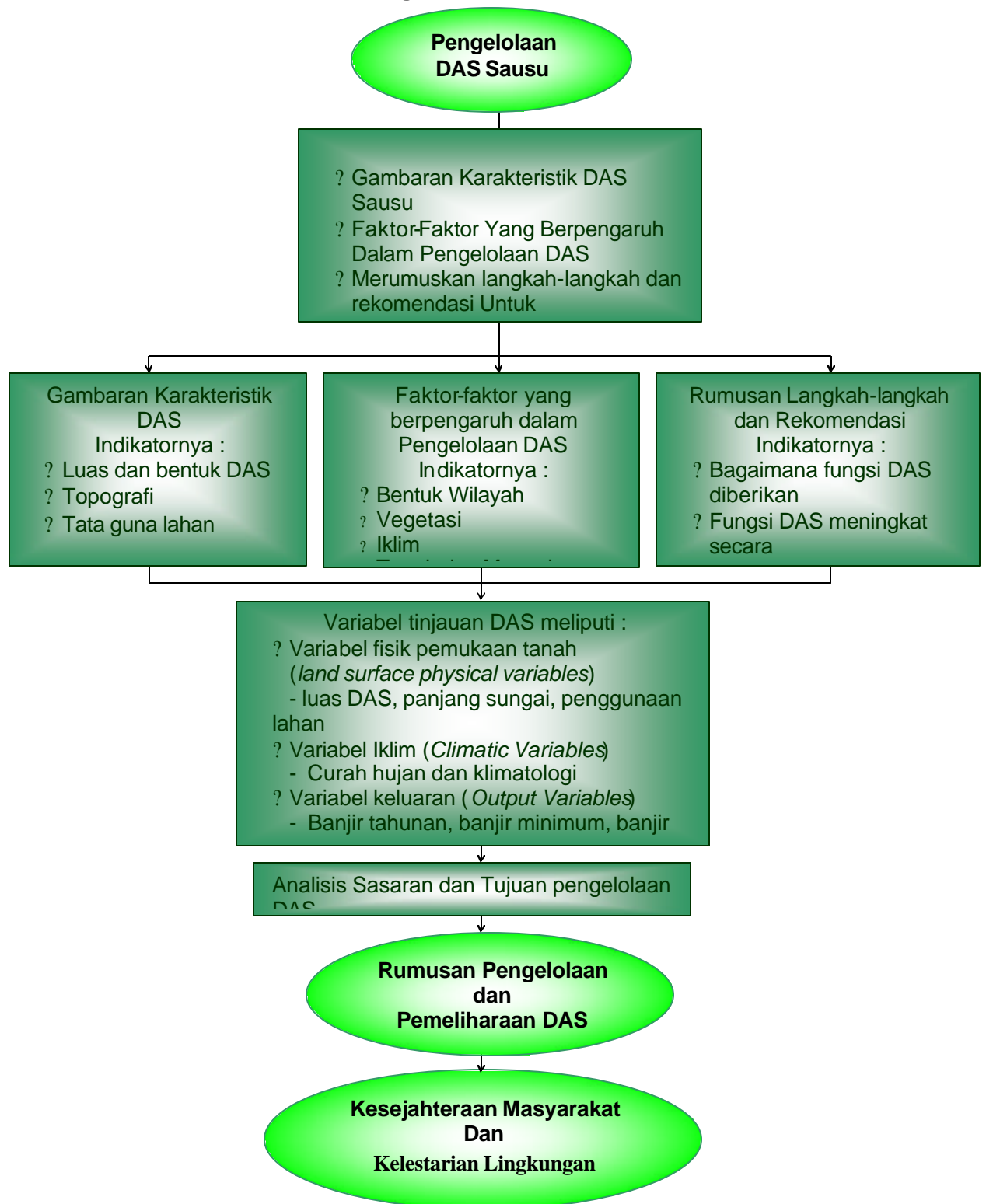
Gambar 2.2 Kerangka Pikir Penelitian