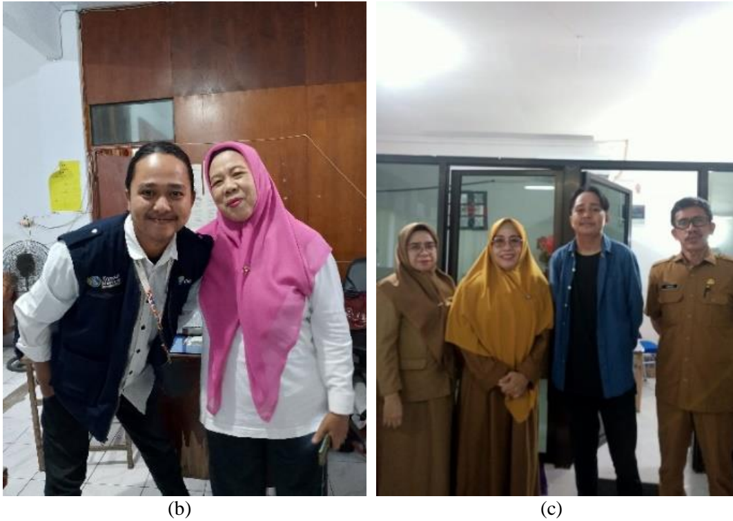
(b) (c) Gambar 50 Pengambilan data di OPD Kabupaten Gowa (a) Badan Pendapatan Daerah (b) Dinas Pekerjaan Umum dan Penataan Ruang c) Dinas Pariwisata dan Budaya