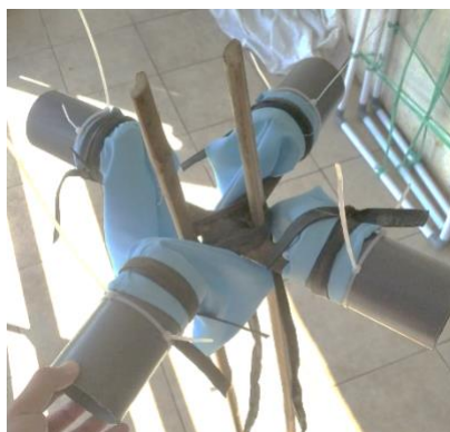
Gambar 2. Sedimen trap 4 arah

Penentuan arah dan besar angkutan sedimen dapat diketahui menggunakan persamaan berikut: