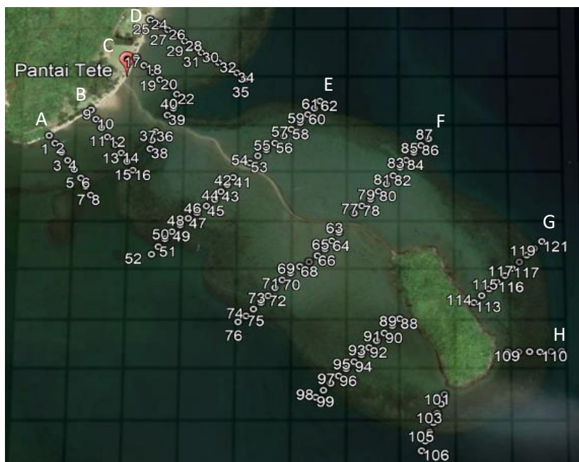
Gambar 3. Titik pengukuran kedalaman

Pengukuran kedalaman menggunakan alat Depth Sounder dan Kompas dengan cara sensor alat diarahkan ke objek lalu menggeser tombol on power , kemudian akan muncul tampilan layar yang menunjukkan angka kedalaman air dalam satuan meter. Penentuan titik kedalaman menggunakan grid yang di buat menggunakan bantuan software Google Earth dengan jarak setiap titik 30 meter ke arah laut dengan sebanyak 8 garis penampang yang terdiri dari 121 titik.