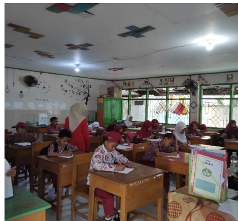
Gambar 3 dan 4. Pengisian Kuesioner oleh Responden Penelitian