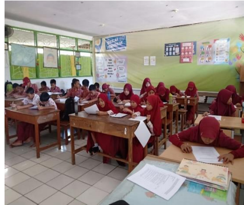
Gambar 1 dan 2. Pengisian Kuesioner Uji Validitas