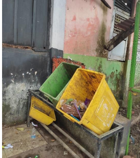
Gambar 2. Tempat sampah