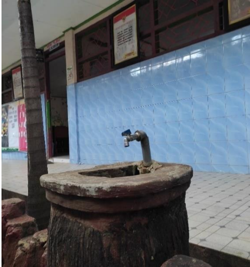
Gambar 1. Tempat cuci tangan