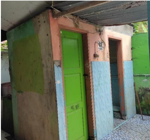
Gambar 3. Kamar mandi