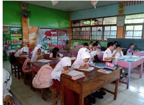
Gambar 3 dan 4. Pengisian Kuesioner oleh Responden Penelitian