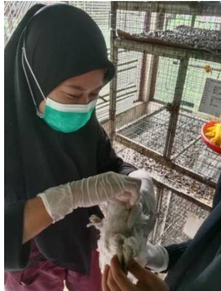
Sampel Usap Kloaka