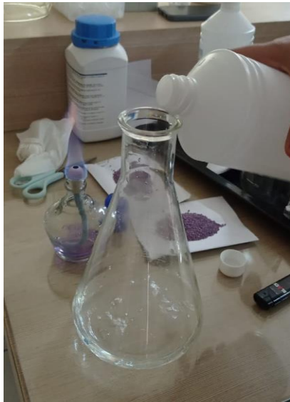
Pembuatan Media EMBA