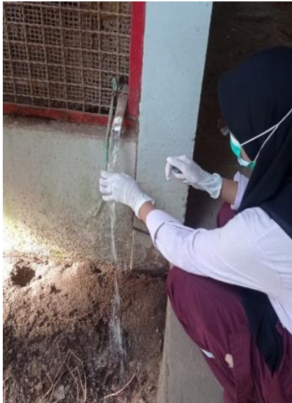
Sampel Air Minum