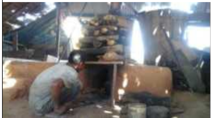
6. Pembuatan Api