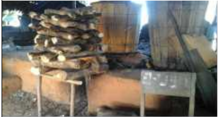
2. Tempat Pembuatan Minyak Kayu Putih