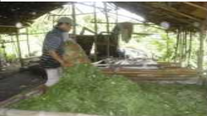
3. Daun Minyak Kayu Putih Di Ketik