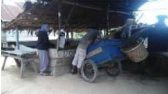
5. Penyimpanan Daun Dan Ranting