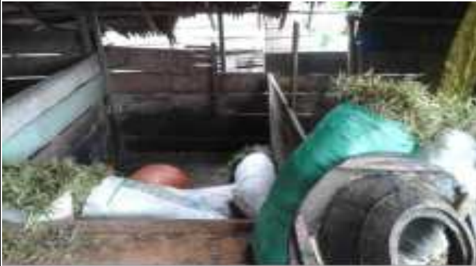
1. Daun Dan Ranting yang habis di Petik