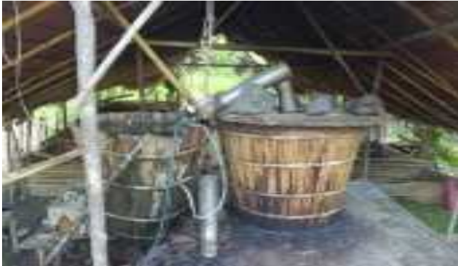
11. Ketel Bambu Tradisional