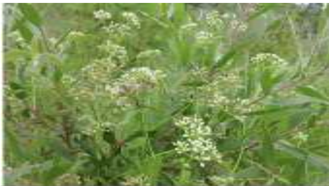
7. Tanaman Minyak Kayu Putih