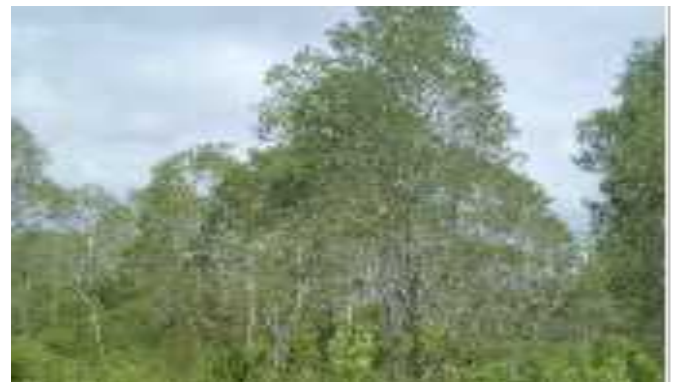
8. Pohon Minyak Kayu Putih