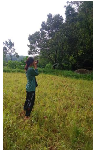
Gambar 17. Pembuatan plot Gambar 18. Inventarisasi Gambar 16. Pembuatan plot