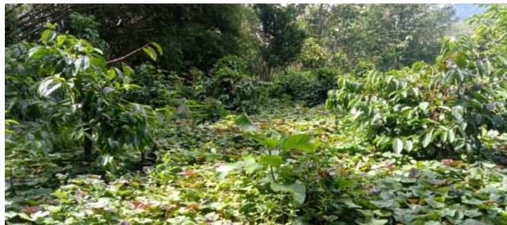
Gambar 24. Lahan sistem agrosilvopastura