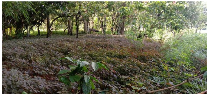
Gambar 23. Lahan sistem agrosilvopastura