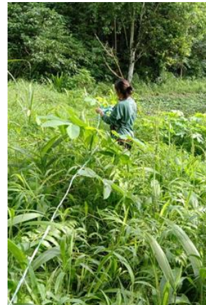
Gambar 13. Wawancara Gambar 14. Wawancara Gambar 15. Pembuatan plot