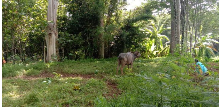
Gambar 22. Lahan sistem agrosilvopastura